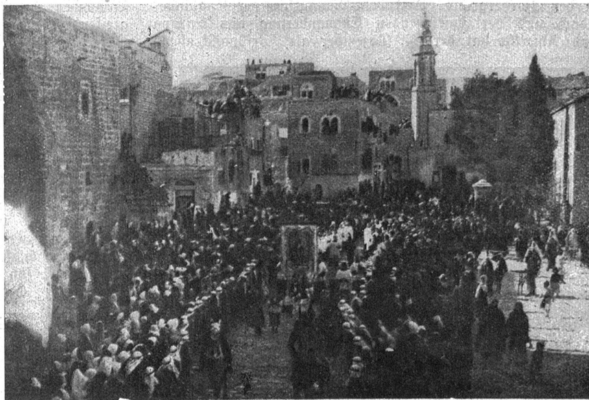
Die große katholische Weihnachtsprozession in Bethlehem. Auffallend groß ist die Teilnahme der Araber.

Früher einmal, als noch die felsige Rhede von Saffa