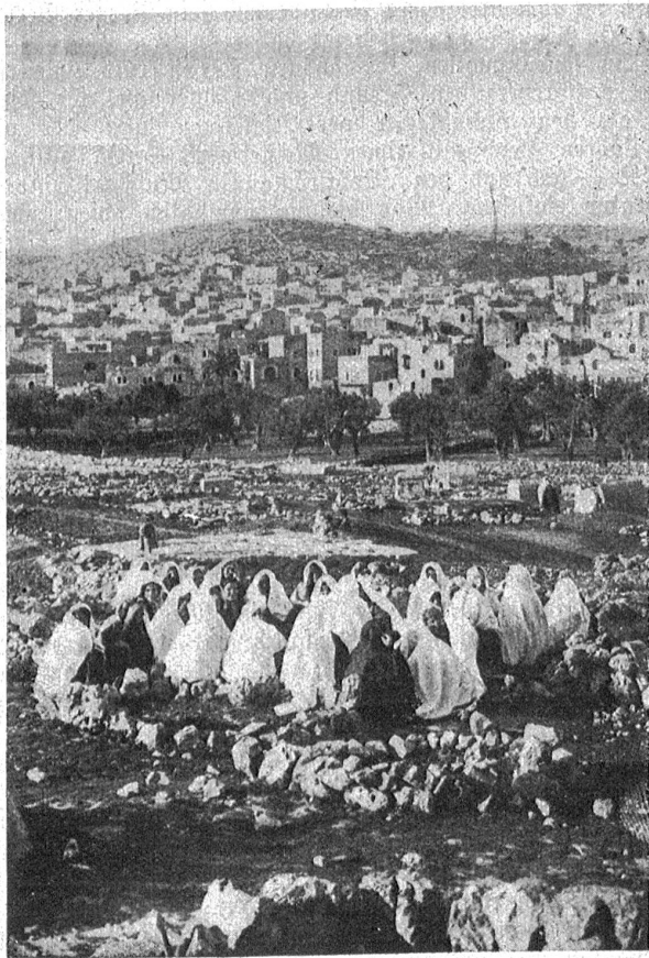
Araberinnen, die aus der Umgebung Bethlehems zum Weihnachtsfeste in die Stadt kommen, erwarten singend und plaudernd den Eintritt der „großen Nacht“.

Da die eingeborenen Christen zum größten Teil dem griechisch-orthodoxen Glauben angehören, traten früher die Weihnachtsfeierlichkeiten nach dem julianischen Kalender mehr