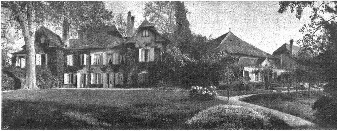
Gutsherrschaft Lonay bei Morges. Herrschaftshaus und Pächterhaus. Typische „Campagne“. (Aus „Das Bürgerhaus der Schweiz“, Bd. XV.)

sucht, lag wieder in guten Händen. Die Leitung der Aufnahmearbeiten und der Sammlung des Bildermaterials besorgte Herr Henry Meyer, Architekt in Lausanne. Seine Zusammenstellung verrät eine souveräne Beherrschung der weitwichtigen Materie und einen geschulten, sicheren Blick in der Auswahl. Ganz hervorragend wertvoll ist bei dieser Bande der Text. Der Verfasser, Herr Fréd. Gilliard, Architekt in Lausanne, weist sich nicht nur als gebildeter Historiker aus, der tief in den Geist der Bauerscheitungen eindringt, sondern auch als glänzender Stilist, dessen Darlegungen man mit steigendem Interesse und Genuß folgen kann.