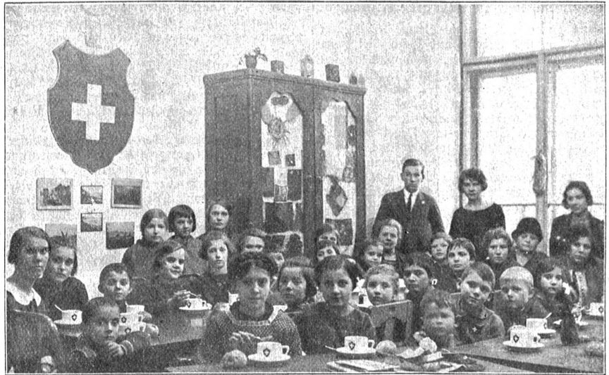
Schweizer Jugendhort in Budapest. Schweizerkinder beim Abendbrot. Leider reichen die Mittel nicht aus zur täglichen Bewirtung.

Als beliebte Anlässe haben sich die Exkursionen unter fachmännischer Führung erwiesen. Es werden dieses Jahr die Gemüsekulturen bei Rezzers und das Wistenlach, bekanntlich unser Zwiebel-land, besucht. Ferner eine Obstplantage bei Neuenburg, dann die dem baldigen Untergang geweihten originellen Anlagen der canadischen Baumschule in Wabern, eine Blumengärtnerei u. a. m. Das gartenfreundliche Publikum wird auf die Tätigkeit der Bernischen Gartenbau-Gesellschaft aufmerksam gemacht. Auskunft