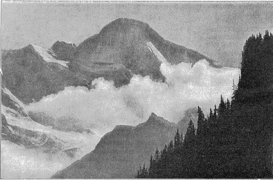
Bei Müren: Das Breithorn.