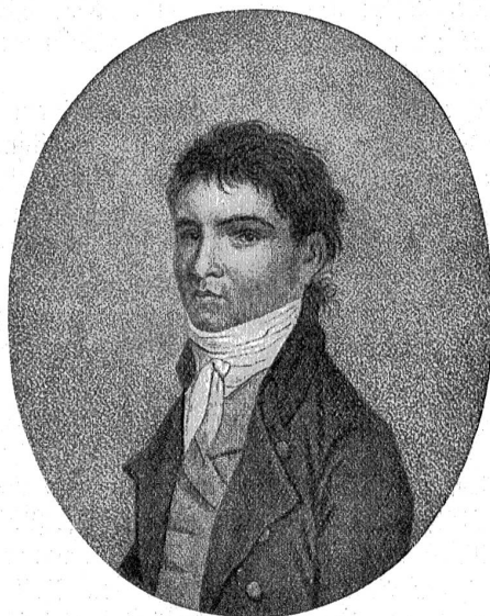
Der jugendliche Beethoven. — Nach G. Stainhauser.

herrlichen „Lied an die Freude“ von Schiller so beseligenden und lebenbejahenden Ausdruck gab!