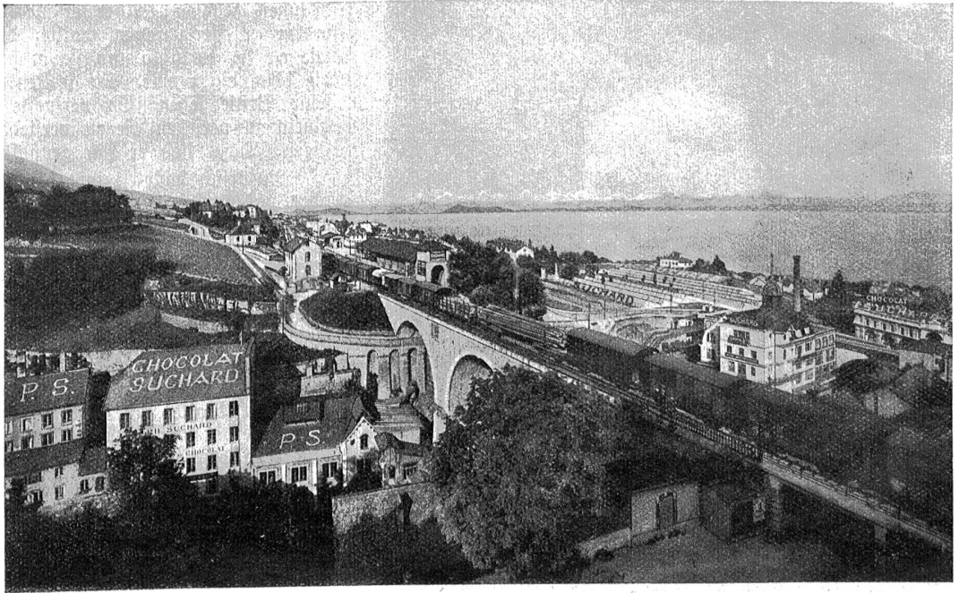
Generalansicht der Schokoladefabrik in Serrières 1926.

Neuenburg 1873. Generalbevollmächtigter und Teilhaber der Firma Suchard 1873. Vizepräsident der Union Chorale Neuenburg 1873. Gründer und Leiter des Deutschen Hilfsvereins 1874. Mitglied des neuenburgischen Generalrats 1875. (Warum versperrt man heute so manchem Tüchtigen den Weg in die Behörden, nur weil er Ausländer ist?) Meister vom Stuhl der Neuenburger Loge 1876. Ehrenmitglied der Union Chorale 1878. Mitglied der neuenburgischen Schulaufsichtsbehörde 1878. Gründer und Präsident der Institution für Ferienversorgung bedürftiger Schulkinder 1880. Führer von 300 Arbeitern und Angestellten der Fabrik und ihren Angehörigen nach Lausanne. Nach dem Tode seines Schwiegervaters und Schwagers alleiniger Chef der Fabrik 1883. Ehrenmeister vom Stuhl der Neuenburgerloge 1883. Gründer der Zweigfabrik in Bludenz 1886. Schatzmeister des Hochschulvereins Neuenburg 1889. Gründer (mit seiner Frau) des Bethanienhauses für die unentgeltliche Aufnahme von Kindern während der Krankheitszeit ihrer Eltern 1891. Gründer der freimaurerischen Mündelpflege 1892. Besucher des Heiligen Landes 1892. Gründer einer Stiftung für heiratende Freimaurerkinder 1893. Führer von 650 Arbeitern und Angestellten der Fabrik und ihren Angehörigen