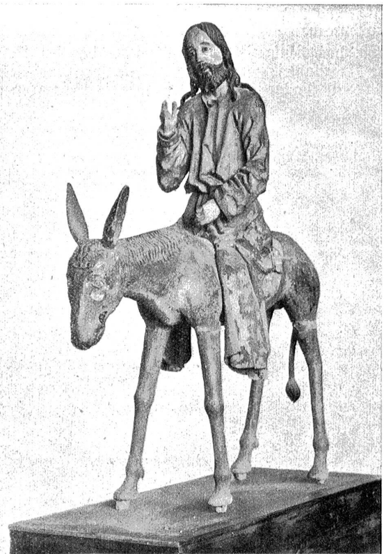
Einer der Palmesel im Berner Historischen Museum.

In früheren Jahrhunderten liebte man es, d. h. bis zum Beginn des 19. Jahrhunderts, in den Kirchen die