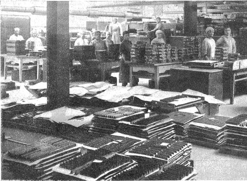
Von der Schokoladefabrikation: Die Ausformerei.

Noch eine Osterblume lockt die Frühlingssonne hervor: die Frühlingsknotenblume oder das Märzbecherlein, das der Volksmund auch als Osterlilie bezeichnet. In schattigen, feuchten Laubwäldern wächst die schneeglöckchenähnliche Blüte schon sehr zeitig im Jahr ans Licht. So ziemlich der einzige Aberglaube, der sich an sie heftet, ist der, daß man drei Blüten pflücken und sich bei jeder einzelnen einen Wunsch denken muß. Der Wunsch derjenigen Blüte, die zuletzt wehkt, geht dann in Erfüllung. In manchen Gegenden wird auch der Löwenzahn als Osterblume bezeichnet, ohne daß sich indes ein besonderer Wunsch- oder Schreckglaube an ihn knüpft. Das einzige, was ihn einigermaßen in Verbindung mit dem Osterfest bringt, ist die Bezeichnung W a j e s h a n z (auch Wajefäke! ), die er in einigen Landstrichen der Schweiz führt, und die im Zusammenhang mit den alten Kult-Osterfuchen, den Wajen , stehen soll. (Nat. Ztg.)