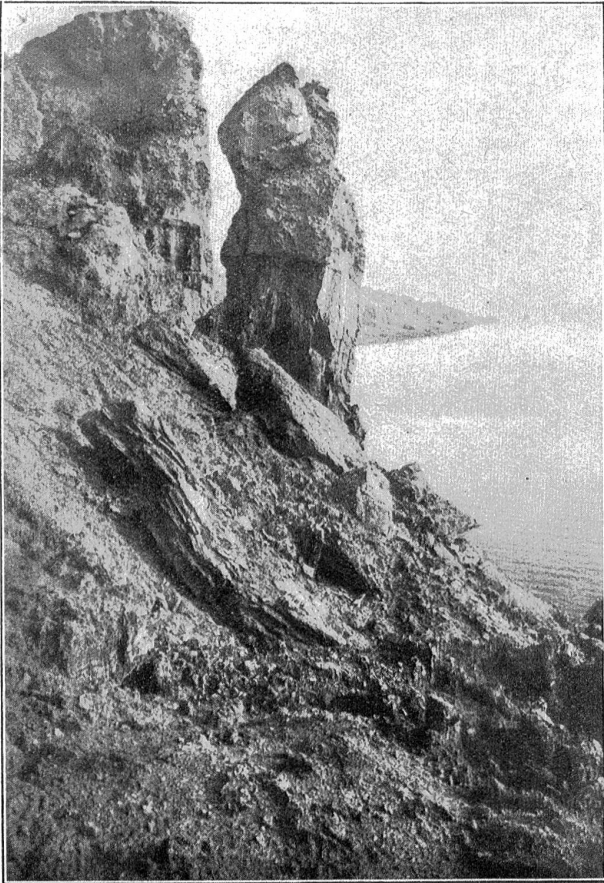
Die Salzsäule von Sodom.

Eine wissenschaftliche Expedition der amerikanischen Howard-Universität ist seit Monaten an der Arbeit, um den Ort, eventuell Reste der Städte Sodom und Gomorrha zu finden, die nach der biblischen Legende im Becken des heutigen Toten Meeres gestanden sind. An der südwestlichen Küste des Salzsteingebirges zeigen die dort ansässigen Beduinen eine sonderbare, phantastische Salzsteinformation, einen Frauenleib von gigantischer Größe. Unter den Arabern ist die Sage verbreitet, daß dieses Steingebilde, die nach der Legende zu Salz erstarrte Frau des Lot sei. Hier ist jedenfalls ein seltenes Spiel der Natur der morgenländischen Phantasie zu Hilfe gekommen.