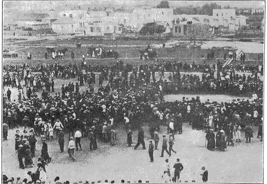
Ostern in Jerusalem. — Sportfest — das lebende Schachspiel.

Alle in Jaffa und Haifa eintreffenden Dampfer, sowie die Züge aus Ägypten, bringen schon vor der Karwoche sehr viel Touristen, darunter zahlreiche geschlossene Pilgergesellschaften aus aller Herren Länder nach Jerusalem. Die Stadt, besonders die christlichen Viertel, stehen um diese Zeit auch mehr als sonst im Zeichen des größten Festes der Christenheit. Pilgerzüge bewegen sich unter Führung landsmännischer Ordensgeistlicher und Vorantragung von Kirchenfahnen, Psalmen singend zunächst zum Pilatusbogen, am Anfang der Via Dolorosa. Hier wie auch vor den Kapellen der Kalvarie-Stationen in den engen, bergan führenden, altarabischen Gäßchen werden kurze Andachten gehalten. Ein Pilgerzug löst vor den Stationen den andern ab. Die Andachten finden auf der Straße