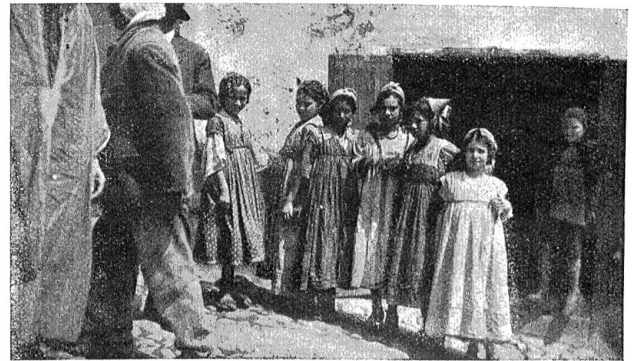
Arabische Mädchen in einer engen Straße in Constantine.

dient dem Heilung suchenden Kurgast als Aufenthalt; schade nur, daß der Zug nicht anhält, damit man das Wunder besichtigen kann, was gewiß eine gute Reklame wäre.