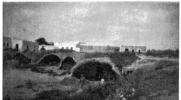
Alle römische Cisternen in Carthago (selt Höhlenwohnungen).

Um das Schaukeln des Schiffes weniger zu spüren, hielten wir uns im Fumoir auf und machten einen Zuger zu dritt, neunzehnmal auf 150 Punkte, während ein Versuch in der Radiokabine keinen Erfolg hatte, da der Empfänger nicht auf Bern reagieren wollte, dagegen waren Rom, Barcelona und Malaga sehr gut hörbar. Wir hatten wieder den Vorzug, geräumiger auf Deck gelegener Kabinen und schwelgten in sanftem Schaukeln des Schiffes in herrlichen Erinnerungen an Bisra, der Kahlenhochzeit, 2000 wiedergefundener Franken und herrlich gebauter, schlanker Arabermädchen. Noch ein langer Tag und eine Nacht ohne Wechselung, als die Aussicht auf das in leichtem Nebel erkennbare Sardinien und Korsika, und dann 1/2 Uhr morgens das Signal der Dampfpeife, daß Marseille in Sicht sei. Wieder ganz fahrplanmäßig ging der „Duc d'Almale“ im Hafen vor Anker; der Zoll war bald erledigt, d. h. bis an unsern Berner Mitpassagier, dem sein Tuniesier-teppich, weil er ihn vorsorglich eingepackt hatte, etwas teurer gekommen sein dürfte, als wenn er ihn in Bern gekauft hätte. Auf der Heimreise nach Genf machten wir noch einen Abstecher nach Nîmes, um den alten Römerstätten einen Besuch abzustatten. Die Arena, die zweitgrößte existierende,