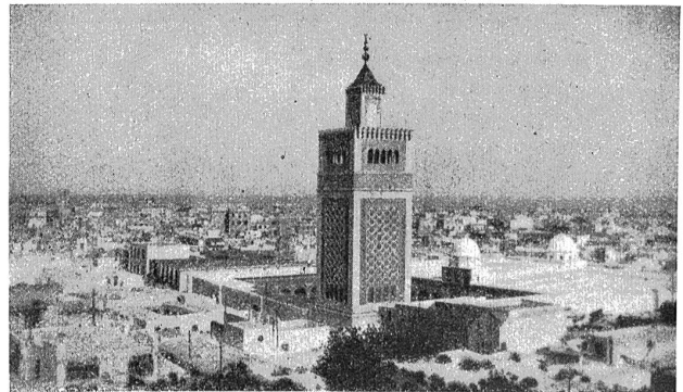
Blick auf Tunis und die große Moschee.

ein Wasserquantum von nur 2,4 Liter aus der öffentlichen Quellwasserversorgung. Es ist daher begreiflich, daß die