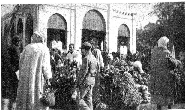
Gemüsemarkt mit Markthalle in Tunis.

Rechnen wir die damalige Bevölkerung der Stadt Bern zu 7000 Seelen, so kommt auf jeden Bewohner per Stunde