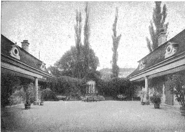
Eingang zum Hofgut Gümligen bei Bern. Beidseitig Brunnennischen, anschließend das Peristyl mit Wandmalereien. Aufnahme von Albert Stumpf, Bern.

„Ich gehe gleich!“ Er stand auf und trat an den Ofen heran. „Auch du wirst kommen, wenn du dich frei machst. Aber dein Kampf wird hart sein!“