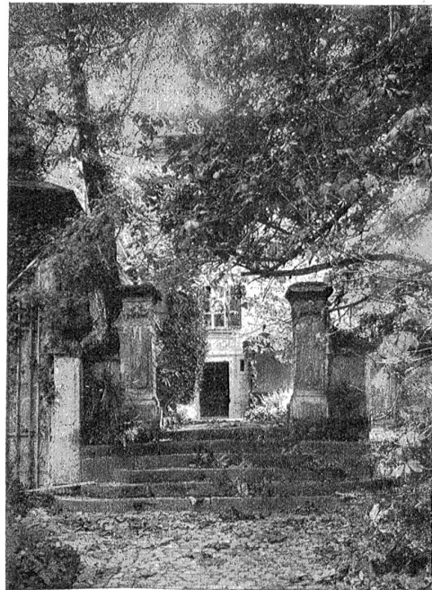
Alter Treppenaufgang, von reichgeschmückten Postamenten flankiert. Die Holzkistchen in den Ecken mit Dracaenen sind überflüssig; besser wären Kugel mit Buchfen. (Schloß Muri.)

Im Tor kommt bald die Idee der menschenfreundlichen Gastlichkeit, bald die der vornehmen Abgeschlossenheit zum Ausdruck. Auch hier Charaktersache, den Geist des Hauses und seines Besitzers verratend. Die beiden steinernen Torpfosten mit den Basen darauf erscheinen wie dienstbeflissene, galonnierte Diener, die zum Empfang der Gäste hieher gestellt sind. Die anschließenden Mauern mit ihren leicht nach außen greifenden Bogen machen die Gebärde der freundlichen Ein-