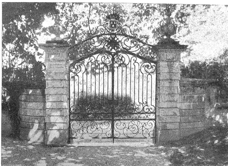
Das Zurückweichen der seitlichen Stügelmauern nach dem Garten hin erhöht die Wirkung des Portales mit dem eleganten Eisengitter und den Postamenten in Berner Barock (von Bürenstock, Bern).

Den heutigen Bauherren und Architekten fehlt vielfach das Verständnis für das gute Verhältnis zwischen Natur und Kunst bei Garten- oder Toranlagen. Zu störend tritt da oft das künstlich Gewollte, die kalte nackte Mauer, das mehr abwehrend als empfangsfreudige Holzportal, der vornehm sein sollende Namenschild etc., hervor. Die Gärten selbst sind nicht nach räumeschaffenden, sondern raumauf-teilenden Prinzipien angelegt. So kann auch der Garteneingang nicht zu seiner naturgegebenen Funktion kommen, nämlich der, vorzubereiten auf die Räume, die hinter ihm liegen und auf das Persönliche, das in diesen Räumen waltet.