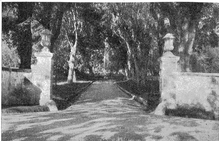
Zufahrt zu altem Berner Herrensitz (Oberried bei Belp). Die Pfeiler wirken wie Rahmen zum reizvollen Bild der Allee mit dem Wasserbecken und Springbrunnen im Hintergrund.

Steht auch den Löwen der Meere ein weit ausgedehnteres Gebiet zur Verfügung, so leben sie dennoch nicht vereinzelt zerstreut, sie zeigen vielmehr erhöhten Geselligkeitssinn. Ein Streifen der patagonischen Küste von 5 Kilometern in der Länge und etwa 15 Metern in der Breite ist alljährlich in den dortigen Frühlingsmonaten, also vom Ok-