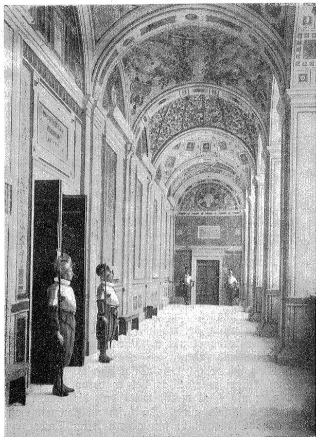
Schweizergardisten beim Wachtelentst.