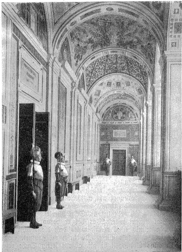
Schweizergardisten beim Wachtelentst.