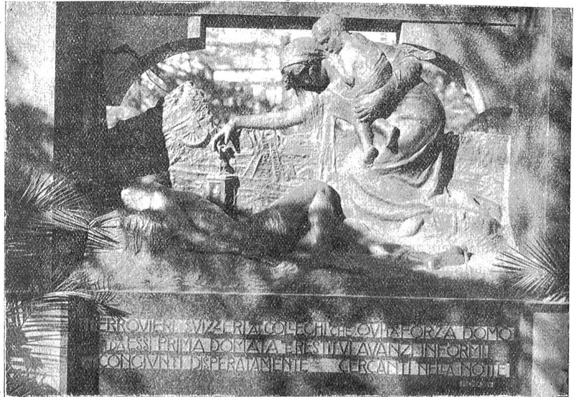
Denkmal zur Erinnerung an die bei der Eisenbahnkatastrophe in Bellinzona (April 1924) umgekommenen Eisenbahner. Der Entwurf des kürzlich eingeweihten Denkmals stammt von Bildhauer Prof. Giuseppe Chiattone in Lugano.

Wo ds Stini isch zueche trappet, het es ds Mul offe vergässe. Der Wikari het ds Bethli uf den Arme gha, wäge der Glungge versteinet sech, u beidi zäme hei drngluengt, wie wenn sie grad us em Himmel abe chäm.