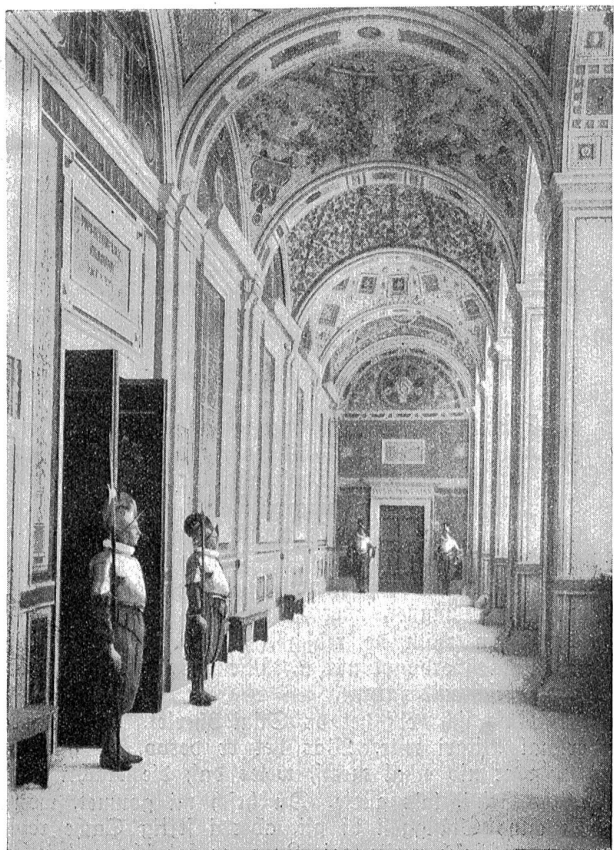
Schweizergardisten beim Wachtelentst.