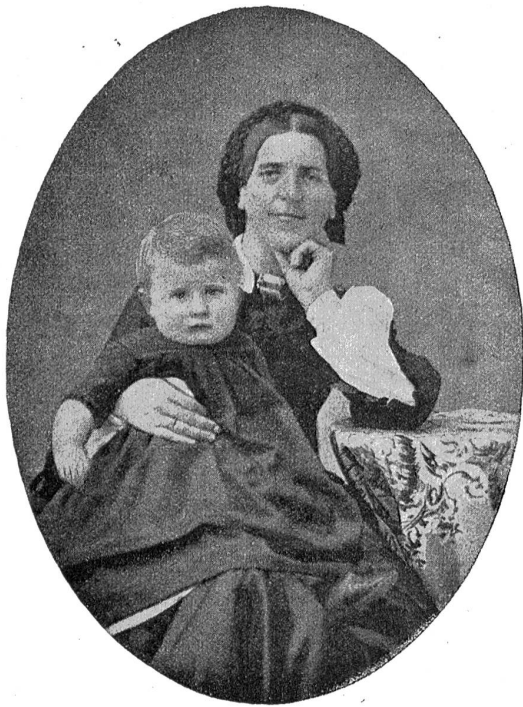
Johanna Spyri als junge Mutter.

nimm dich der Spenglersfrau an, wenn sie in Not kommen soll. Versprichst du's mir?"