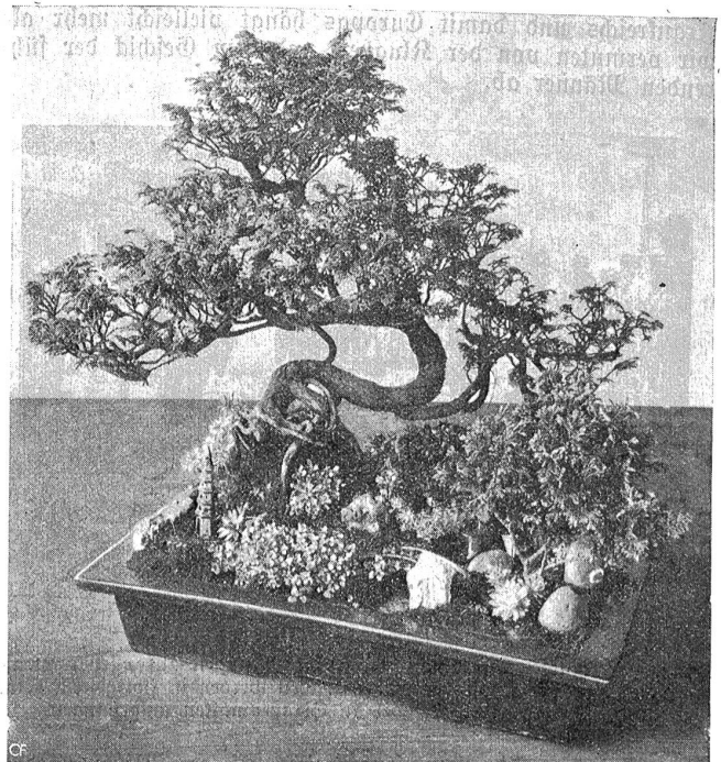
Japanische Miniaturgärten mit winzigen Zwergformen gewöhnlicher Obstbäume.

Eine alte Tradition ist in Japan die Pflege von Zwergbäumchen in winzigen Miniaturgärtchen, wie unsere Abbildungen sie zeigen. Die Japaner sind Gärtner aus Anlage. In keinem anderen Lande spielen die Blumen und Blüten eine solche bedeutungsvolle Rolle als Faktor des Lebensgenusses wie in Japan. Stundenlang kann sich der Japaner und seine Familie bei der Betrachtung seines Blumengärtchens verweilen. Mit ganz besonderer Hingebung pflegt der japanische Gärtner auch seine Zwergbäumchen. Er setzt seinen Stolz darin, recht kleine Zwergformen der gewöhnlichen Obstbäume zu kultivieren. So soll es vorkommen, daß in solchen Miniaturgärtchen hundertjährige Kirschbäume stehen, die alle Jahre ihre Blüten und Früchte bringen und dabei kaum eine Elle hoch sind.