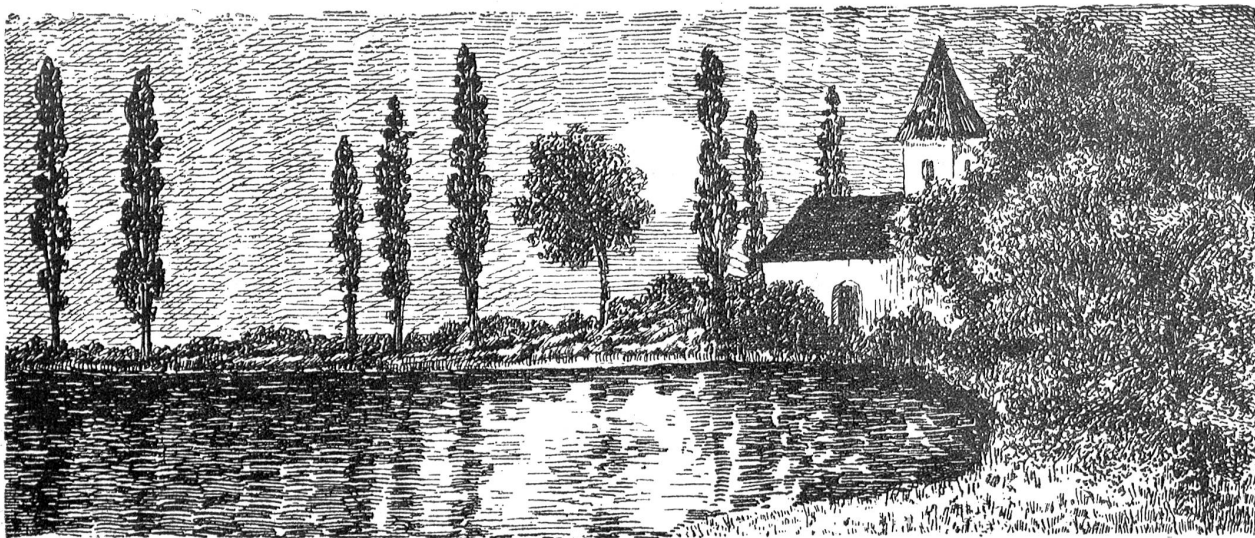
Olga Amberger: Mondnacht.