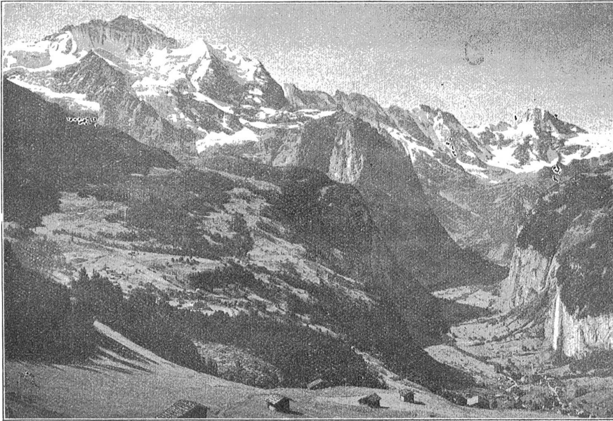
Wengen. Blick ins Lauterbrunnental.