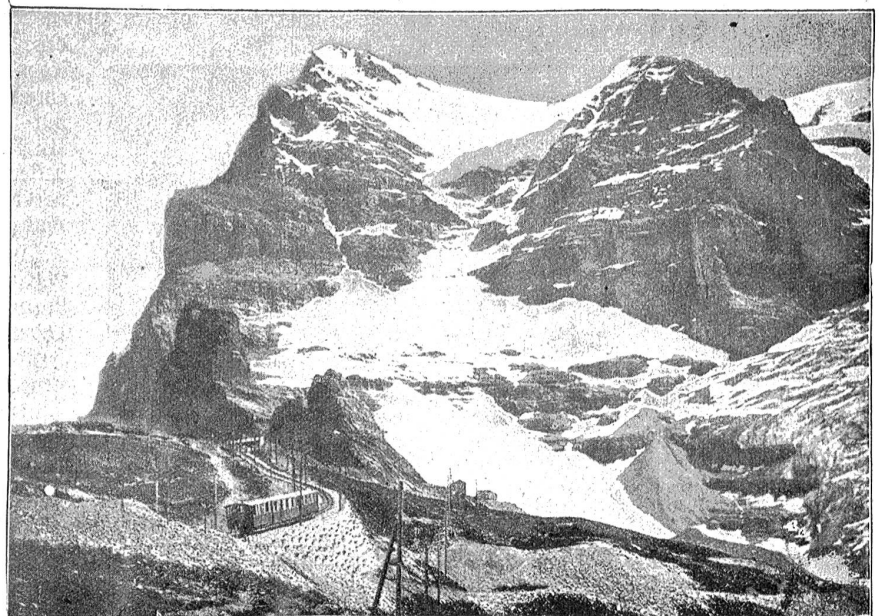
Der Eiger von der Jungfrau aus.

Ein Autoführer lädt uns zu einer Fahrt nach den Wasserfällen ein. Wir ziehen es aber vor, die Tour per Fuß zu unternehmen. Weit ist sie ohnehin nicht. Der Staubachfall liegt rechts am Ende des Dorfes. Um ihn zu erreichen, müssen wir von der Landstraße abzweigen und einen Obolus von 30 Centimes entrichten. Das bescheidene Zutrittsgeld rechtfertigt sich durch die Bauarbeiten, die notwendig waren, um den Besucher recht nahe an den berühmten Sturzbach gelangen zu lassen. Das Wasservolumen ist momentan nicht groß, der Fall mag zu andern Zeiten, wenn im Frühling der Föhn in die Schneemassen fährt, einen stärkeren Eindruck erwecken. Im Jahre 1779 stand hier der dreißigjährige Goethe und holte sich seinen Stoff für das unsterblich gewordene Gedicht: „Gesang der Geister über den Wassern“.