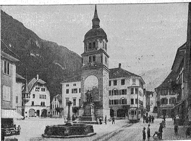
Dorfplatz in Altdorf mit Telldenkmäl.

Es braucht keine prophetische Befähigung, um den Altdorfern eine schöne, gesegnete Zukunft voraussagen zu können. In seiner jetzigen Art stehen die Tellaufführungen sicherlich einzig da und werden nicht so leicht wieder verschwinden.