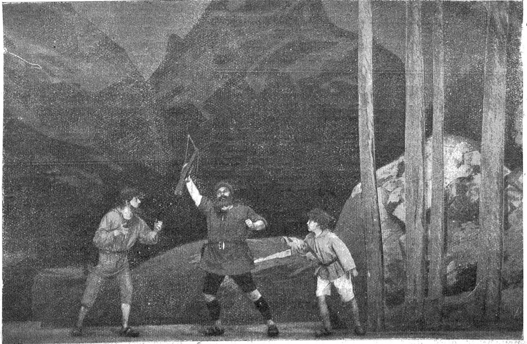
Cellspiele in Altdorf. Szenenbild aus dem IV. Aufzug, 2. Szene: Cell erzählt dem Sifcher und dem Sifcherknaben seine Rettung aus Gefäblers Schiff.

Sanft steigt der Boden des Zuschauerraums nach hinten an, auf dem in gerader Ordnung in ungefähr 42 Sitzreihen