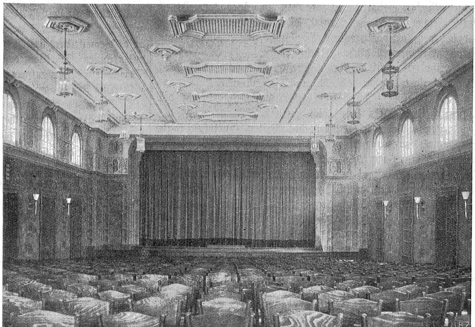
Das Tellspielhaus in Altdorf. — Saal, Blick gegen die Bühne.

Und erst, wenn sie spielen. Es sind nicht mehr Schauspieler, die sich auf den Brettern bewegen und die betreffenden Personen nachzuahmen suchen. Nein, man glaubt wirklich, den Teufel in Menschengestalt vor sich zu sehen, wenn Gekler mit fürchterlicher, wutverzerrter Grimasse den Schuß verlangt. Der Schmerz Arnold von Melchthals um das geraubte Augenlicht seines Vaters ist echt, ein wahrer Schmerz, der sich jäh in heiße, leidenschaftliche Rache verwandelt. Der Tell ist der Mann der Tat, der handelt und wenig spricht.