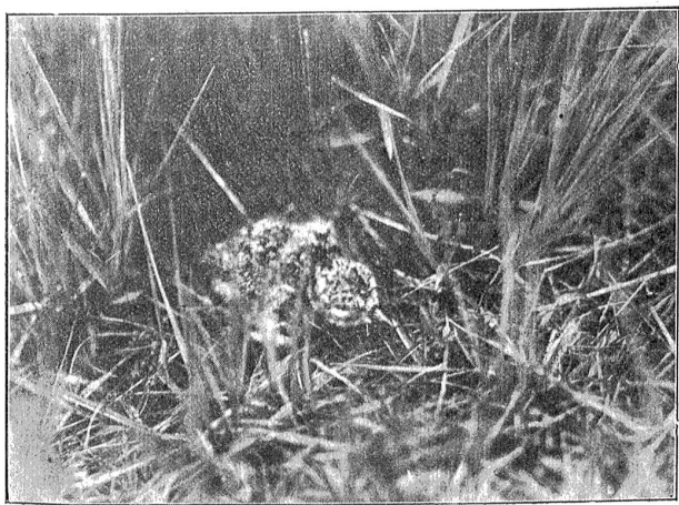
Junger Kiebitz. ? 2

Man muß den Kiebitz etwa in Holland oder Dänemark gesehen haben, wo er durchwegs noch zahlreich ist, um zu erfahren, welche Bedeutung er für die Belebung der Landschaft hat. Er ist ein Vogel der Ebene. Er will die Nähe des Wassers haben. Die Kleinlebewelt um dasselbe herum bietet ihm seine Nahrung. Je weniger die Gegend bebaut