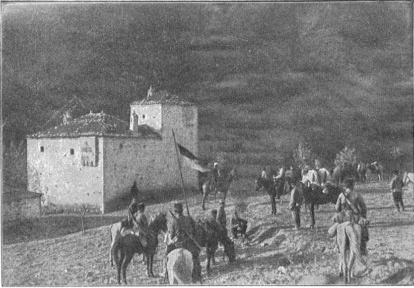
Albanien. Eine 'Kula, albanisches Steinhaus im Gebirge.

Was aber nicht jeden freut, ist die immer tiefere Einsicht, daß die schöne Genfereinrichtung sich zu einer Schreiber- ausbrütungsanstalt größten Stils auszuwachsen beginnt. Schon heute, wo sie doch noch in den Anfängen steckt, stellt sie das gigantischste Bürokratenwerk aller Zeiten dar. Und ungeheuerliche Erweiterungspläne harren noch der Ausführung. Was aber an Beamtenkasernen fertiggestellt wird, füllt sich augenblicklich mit Völkerbundsdienern aller Länder, Rassen und Farben. Und alle diese Leute arbeiten emsig weiter am Ausbau der Friedenswarte, schaffen Zelle um Zelle und blähen das Werk bis zur Unkenntlichkeit auf. In absehbaren Jahren wird die Völkerbundsverwaltung eine Unmenge von Palästen ihr eigen nennen, die die verschiedensten Dienstzweige abgesondert beherbergen werden. Einer z. B. für den Mädchenhandel, einer für das Opium, einer für das Kokain und weitere für die Bekämpfung der Tuberkulose, des Alkohols, der Schundliteratur und der Arbeit. Nur die Kriegsgegner dürften Mühe haben, unterzukommen; bei den Sparjamkeitsbestrebungen der Spielleiter in Genf ist es nämlich fraglich, ob ein Kriegsgegneramt errichtet wird, da in Bern bereits ein internationales Friedensbureau und in Luzern ein Friedensmuseum bestehen.