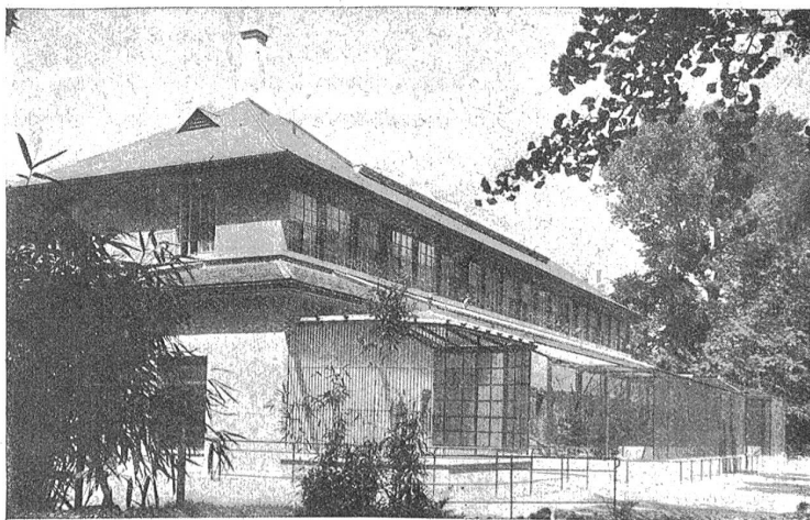
Das neue Vogelhaus im Zoologischen Garten in Basel. Außenansicht.

Mitten im Winter, wenn es draußen stürmt und schneit, wird man im warmen Raum, mitten unter Pflanzen die