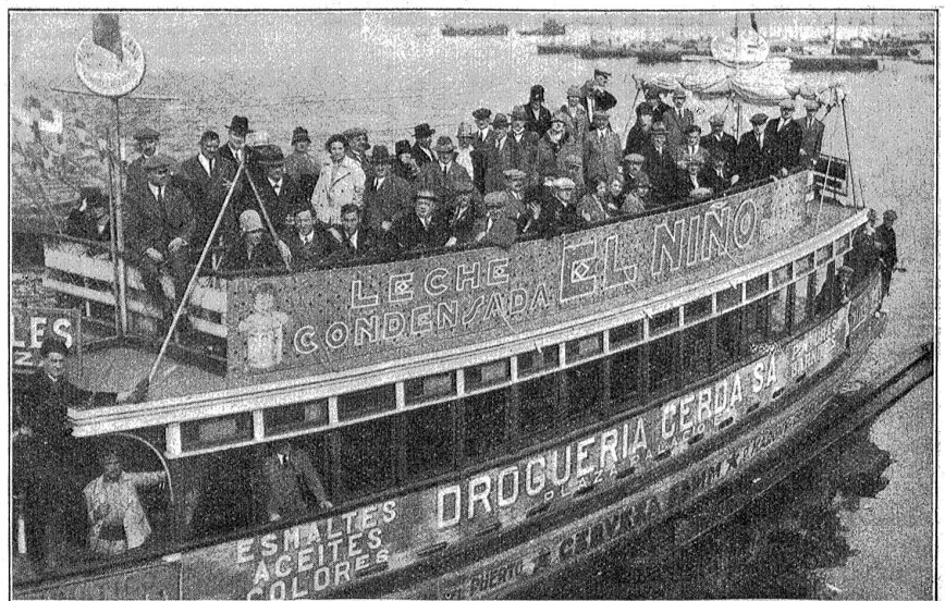
Bahnenfahrt der Berner Stadtmusik in Barcelona.

Das große Sterben, wie der herbstliche Laubfall in der Literatur heißt, hat eingeseht. Die Farbenpracht aber, die diesem Absterben vorangeht, ist gerade in Bern, das infolge seiner Bauart die Natur noch nicht so sehr verdrängte, besonders schön. Das Erbleichen der Blätter, das dem endgültigen Abfallen vorangeht, bringt ein Farbenspiel sondergleichen zuwege, denn jeder Baum, jeder Strauch hat seine Farbe für sich. Zwischen den Willen und Häusern der Abhänge zittert das helle Gelb der Birke; der Ahorn, der in Bern etwas seltener ist als in andern Schweizerstädten, wetteifert in der Zartheit dieser Nuance. Die Zitterpappel hat eine andere Nuance, gelb, mehr zitronengelb, und die Pappel der Landstraße, die in unsern Tagen immer seltener wird, ragt in noch einem andern Gelb in die Luft. Von Gelb alle Stufen. Die Anlagen