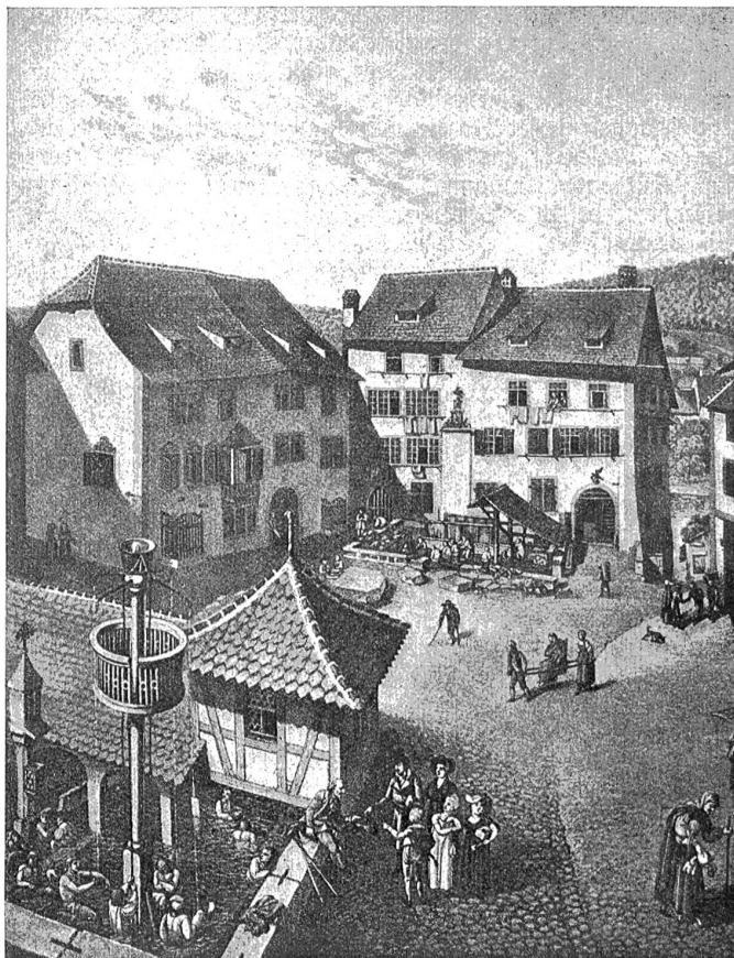
Badeplatz im Jahre 1805.

Eine erste ausführliche Studie über die Bäder schrieb im Jahre 1512 der württembergische Arzt Doktor Sig, der sich in Baden als praktizierender Arzt niedergelassen hatte. Die damalige Kur dauerte 4 bis 8 Wochen mit täglich zwei Bädern von 2—4 Stunden Dauer. Man glaubte, das Thermalwasser sauge die Krankheitsstoffe auf. Bevor der Badende ins Wasser stieg, mußte er sich gründlich purgieren lassen. Die Klisterprieße gehörte zur unentbehrlichen therapeutischen Badeausrüstung. Dann trat der Scherer oder Schröpfer feierlichst in Funktion. Er ließ mit 7, 9 oder gar 13 Schröpfpöpschen oft bis zu zwei Pfund Blut ab.