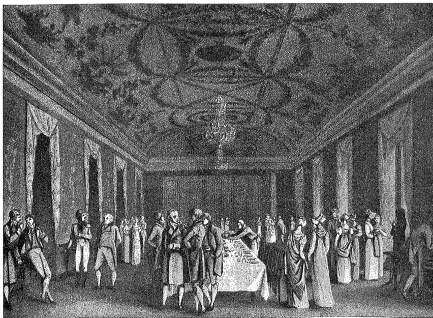
Eine Table d'hôte im Jahre 1813.

Weitaus die größte Rolle spielte in frühern Jahrhunderten die angebliche Heilwirkung der Bäder bei Frauenleiden, namentlich bei Unfruchtbarkeit. Ein großer Teil der weiblichen Badegäste suchte in Baden Befreiung von letzterem Uebel. Sie besuchten das „Berenenbad“, dem besonders günstige Wirkungen nachgerühmt wurden in dieser Hinsicht. Die heilige Berena galt als die Behüterin und Mehrerin der weiblichen Fruchtbarkeit. Sie war aber auch die Heilige der freien Liebe und wurde von Dirnen als ihre Beschützerin angesprochen. Wie die berühmte und in Hinsicht auf ihre losen Sitten berüchtigte Zuzacher Messe wurden im 16., 17. und 18. Jahrhundert die Bäder an der Limmat das Stelldichein der Männer und Frauen aus nah und fern, die sich in sittlicher Ungebunden-