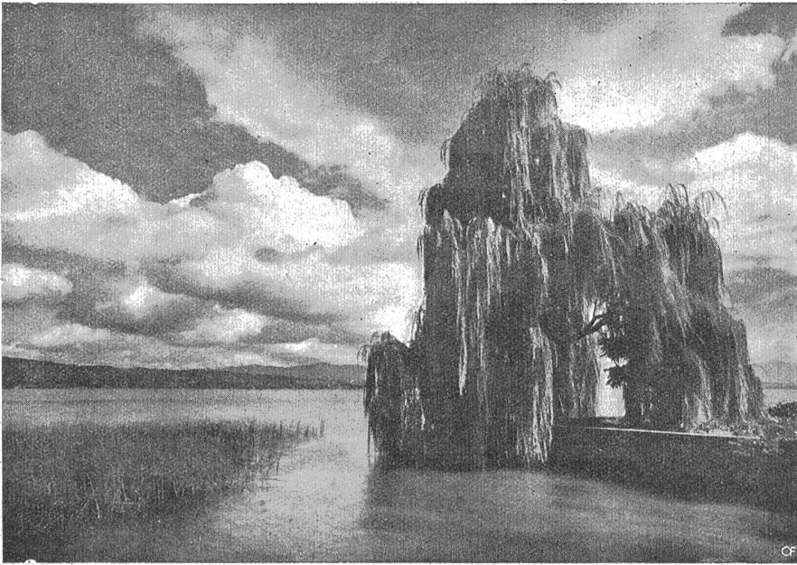
Am Zürichsee.

Seemauer und schaute in die Nacht hinaus. Weithin dehnte sich die Bucht. Die Ufer waren anzuschauen wie zwei lange, mit tausend gelben Lichtpünktchen besetzte, schwarze Arme, welche den See umfaßten. Nur oben mochten sie nicht zusammen. Dort träumten ferne, blaue Berge in Nebeldunst. Der Mond stand blank und voll am Himmel und goß in verschwenderischer Fülle sein bleiches Licht auf Land und Wasser aus. Der See war verschlossen, weder Haus noch Himmel spiegelte er. Wie flüssiges Blei bewegten sich die Wellen auf und ab. Eine schöne, gelblichweiße Straße malte der Mond auf dem Rücken des Sees, die funkelte wie Gold und Silber. Weit, weit hinauf in den See führte sie, wurde immer schmaler und schmaler und hörte irgendwo im Dunkel auf. Wo fing sie an? Meine Blicke glitten auf ihr abwärts. Schon am Ufer glitzerten die ersten Gold und Silberfleden, wie mit feinem Pinsel hingemalt. Ein Liebespärrchen saß auf einer grünen Bank vor dieser goldnen Straße. In-