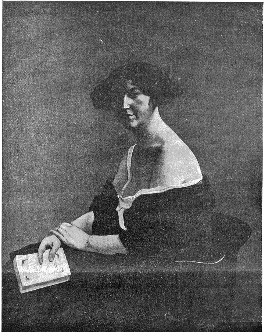
Selix Vallotton: Die Dame mit dem gelben Buch. — (Kollektion P. Vallotton, Lausanne.)

„Und so blieb es; unter ihrer zugleich liebevollen und strengen Pflege ging die Heilung wider mein Erwarten und — trotz des furchtbaren Vergleiches — ich kann dennoch sagen: zu meiner Freude, rasch vorstatten, so daß mir bald