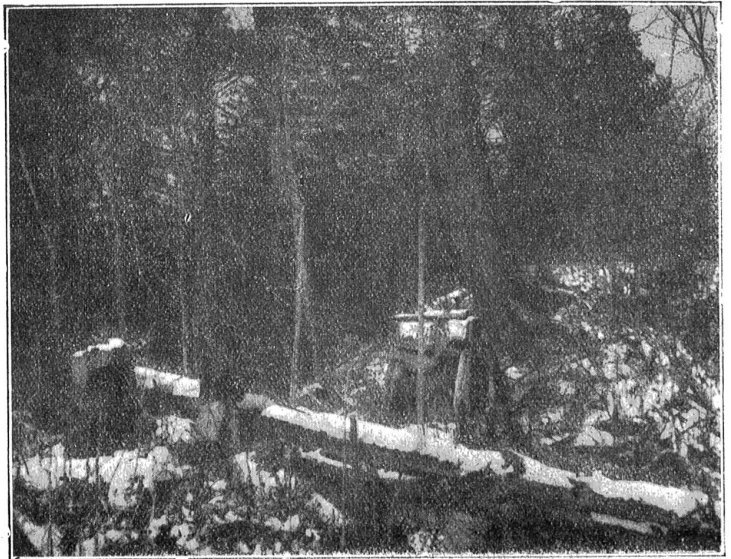
Gebetempel für Shen-Schen-Sucher in der Taiga.

Einzig der Chunchun, der am Taleingang mit seiner Büchse lauert, achtet fremdes Eigentum nicht und trockt dem Zorne der Gottheiten. Oft kommt es vor, das der Sucher, der mit seinen Wurzeln die bewohnten Stätten des Assurigebietes aufsucht, unterwegs abgeschossen wird, nachdem ihm alle Mühen und Entbehrungen nichts haben antun können. Im Busch bleichen dann seine Knochen, während seine Angehörigen umsonst bange auf ihn warten, und während der Räuber seine Habe auf dem Marke in Wladiwostok oder Charbin gewissenlos einem chinesischen Medizimmermann verkauft. Dieser pulverisiert die Wurzel, mischt Panty, Extrakt dickflüssige Masse aus ausgekochten Bärenknochen, Extrakt aus Hirschscrotum und jodhaltige Meerespflanzen in das Pulver und verkauft es zu Willen gepreßt als „Wurzel des Lebens“ an vornehme Leute, welche die Jahre körperlich und geistig schwach gemacht haben.