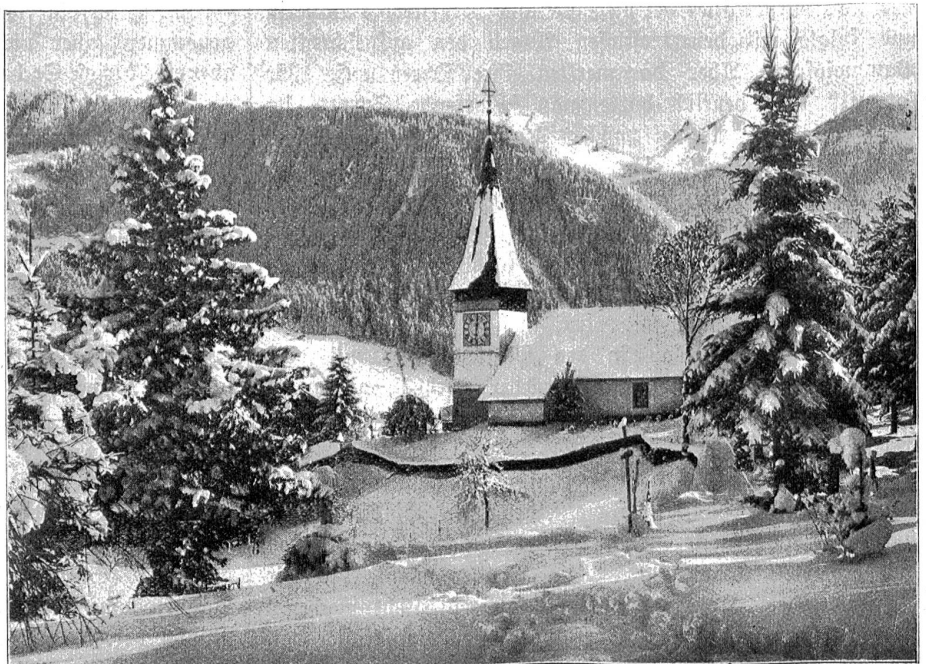
Das idyllische Bergkirchlein in Zwieselminnen.