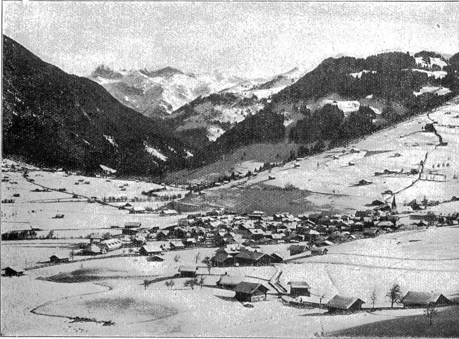
Zwieselminnen im Winterkleid.

einen Draht in den Erdboden leiten können. Warum kommt uns das nicht von Anfang an in den Sinn?"