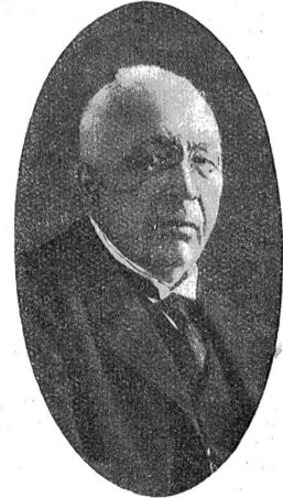
Bundesrichter Dr. Virgile Koffel von Tramelan, Vizepräsident des Bundesgerichtes für 1927/28.

Aargau. In Aarau soll auf dem Areal des von der Hoch- und Tiefbaugesellschaft A.-G. gekauften Hotels „Dahlen“ ein Theatergebäude für 700—800 Personen gebaut werden, welches sowohl für Bühnendarstellungen als auch Lichtspielvorführungen geeignet ist. — In Dottikon wurde bei Korrekturen an der Bünz ein gut erhaltenes Skelett ausgegraben, dessen Schädel an der Stirne eine eingeschlagene Stelle aufweist. Man glaubt, daß der Fund aus dem Willmergerkrieg stamme, da das Skelett mehr als 100 Jahre im Boden gelegen haben dürfte. — Im Hallwylsee geht der Balgenfang von Jahr zu Jahr zurück. Der Grund hievon dürfte in der starken Veralung des Seegrundes und der Zunahme der Hechte zu suchen sein.