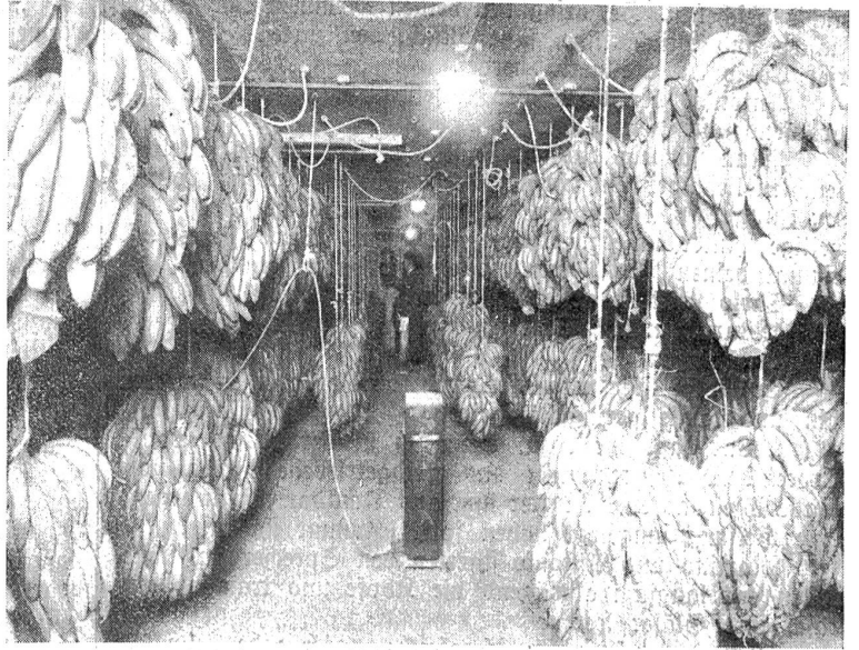
Blick in eine Bananenkammer.

Wenn man noch so lachen kann, und wenn ein solches Lachen noch ein so liebes Bild in uns zu wecken vermag, dann, sagte ich mir, muß es mit der Veräußerlichung und mit dem ganzen Untergangsrummel noch nicht so schlimm stehen. Ich verabschiedete mich und ging in den Sommerabend hinaus. F. A. Wolmar.