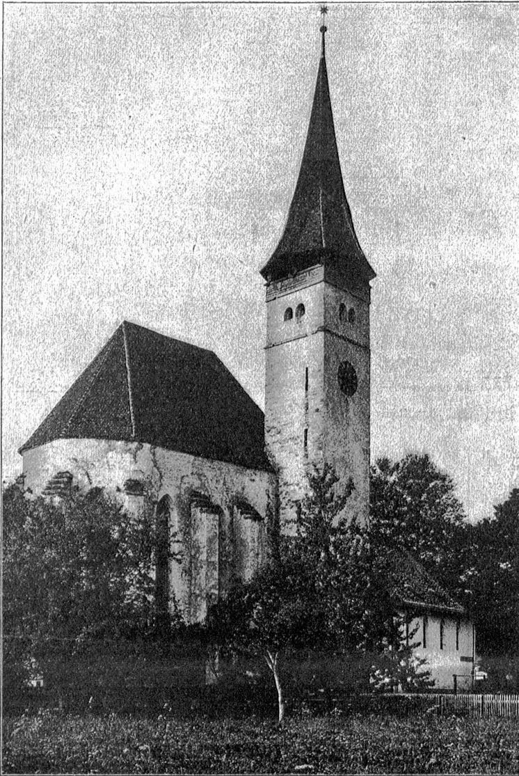
Die Augustiner-Klosterkirche von Interlaken. Aufgenommen vor ihrem Umbau 1910/1911. Aufnahme im Landesmuseum Zürich.