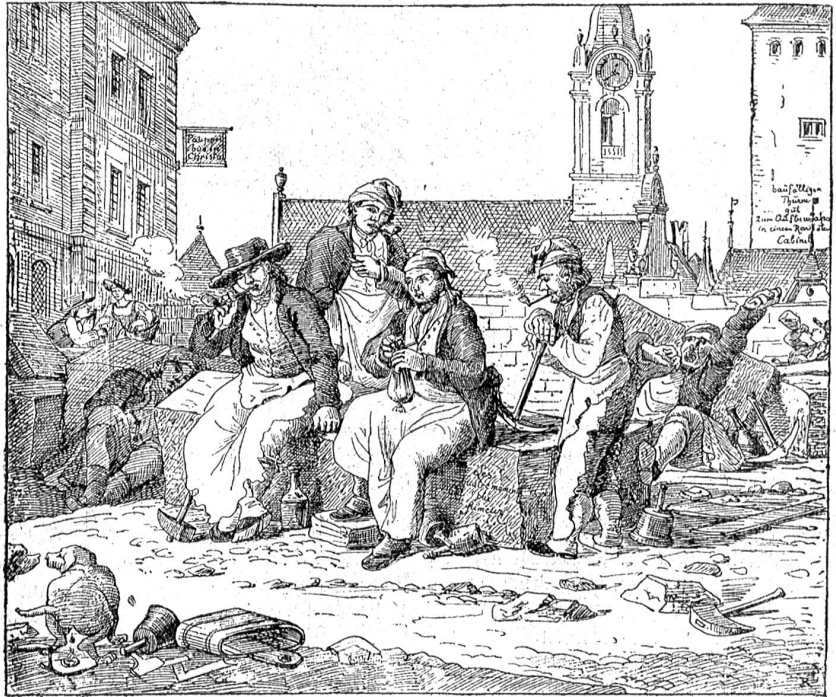
Die fleißigen Steinmehlen des hochadeligen Bauamtes einer Stadt Bern, 1802.

Nach der Heimkunft der Banner kamen auch Botschaften aus Luzern, Uri, Zug, Schwyz und Wallis, die die Unterwaldner zu entschuldigen suchten und meinten, „Es wolten die von Bern vergangene sachen nicht so hoch aufnehmen“. Daraufhin erhielten denn auch die Leute von Hasle und die Interlakner ihre Banner und Freiheiten zurück. Im ganzen wurden überhaupt nur vier Rädelsführer enthauptet, viele aber waren geflohen und wurden ihre Güter eingezogen, was der Chronist am Schluß seines Berichtes so nebenbei erwähnt.