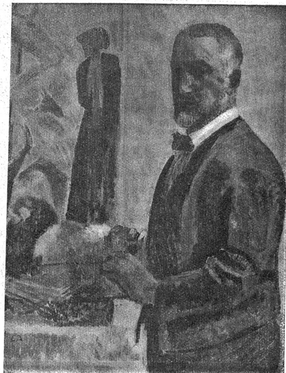
Cuno Amiet: Selbstbildnis.