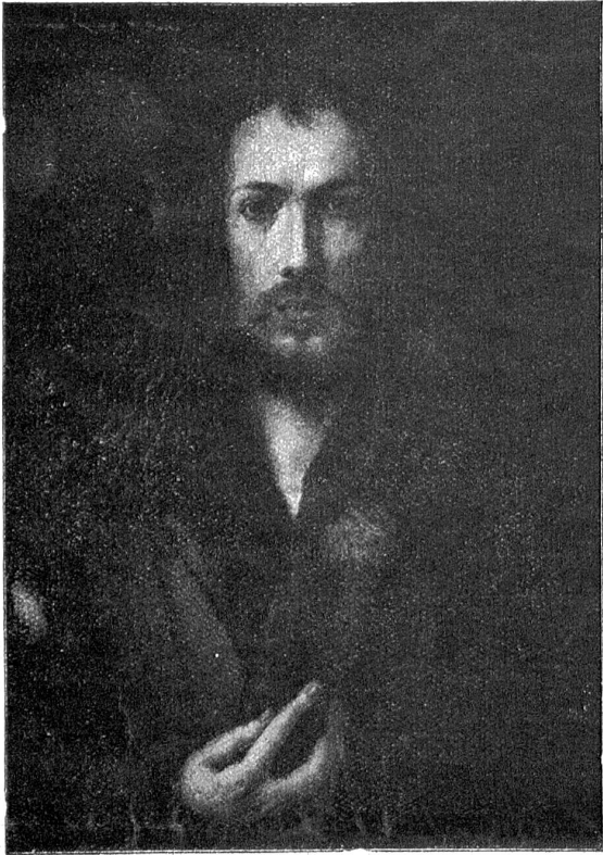
Albrecht Dürer: Selbstbildnis.

wenn er etwas denkt, guckt es wie Wetterleuchten um ihn, man weiß nicht, lacht er, oder ist er traurig. Und sehr schöne Hände hat er. Ich hatte nie darauf geachtet, da sagte ein