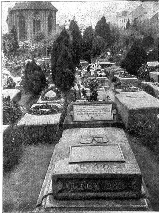
Albrecht Dürers Grab.

reichem Erleben Kunde. In Antwerpen hatte er Gelegenheit, dem Einzuge Karls V. beizuwohnen, der mit großer Prachtentfaltung gefeiert wurde und Dürer aufs Höchste entzückte.