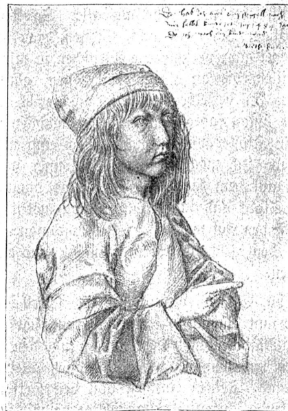
Albrecht Dürer: Selbstbildnis des 13jährigen Knaben.

In dieser Stadt wurde am 21. Mai 1471 Albrecht Dürer als zweiter Sohn von achtzehn Kindern des gleichnamigen Vaters, der ein aus Ungarn eingewanderter Goldschmied war, geboren. Sein Vater „hatte großen Fleiß