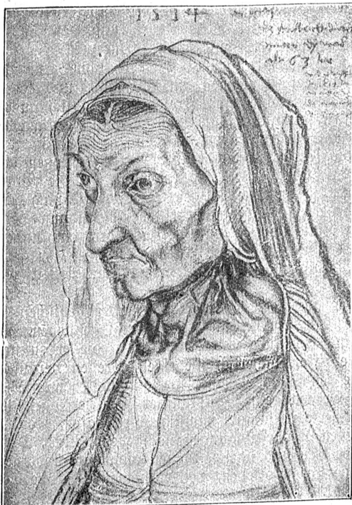
Albrecht Dürer: Das Bildnis seiner Mutter.

jähriger schon hatte er ein Selbstporträt, dessen Züge auch in den spätern Bildern des Meisters erkenntlich sind und