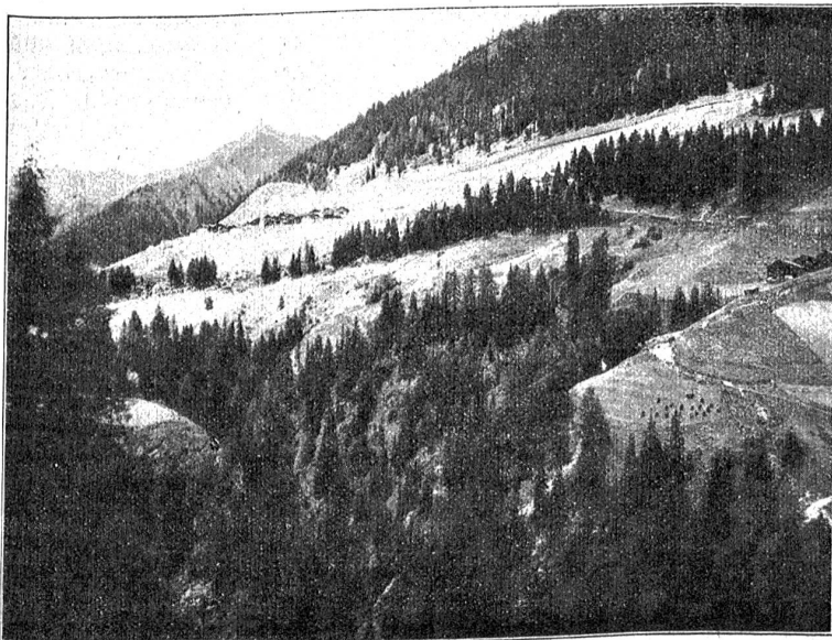
Aus dem Samnaun. Blick vom Straßenaufstieg auf die tirolische Gemeinde Spiz.

Nochmals treten die Felsen nahe zusammen. Plötzlich aber weitet sich vor den erstaunten Blicken ein liebliches Talgelände. Wir sind im Samnaun. Ueberrascht bleiben wir stehen. Wahrlich, eine solche Anmut hatten wir hinter der Steinwüste des Mondin, auf 1700—1850 Meter Höhe, nicht erwartet. Alle Besucher von Samnaun sind sich darüber einig, daß wir dieses Hochtal zu den schönsten Alpentälern der Schweiz rechnen müssen. Welch' bunte Blumenpracht auf den Wiesen! Nir-