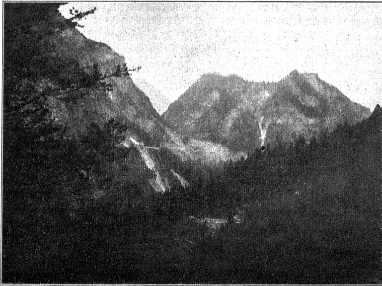
Blick von der Samnaunerstrasse auf die Heerstrasse Pfunds-Nauders.

Erratische Blöcke, Findling, vorsintflutliche Tiere — er ist endlich bei der Kreidezeit angekommen und trinkt sehr viel ihr zu Ehren, und Socius schenkt ein, und uns wird wohl, und durch den roten Schimmer des Chianti sehen wir die Welt, und darauf die Kunst, und endlich die Liebe mit entzückten Augen an. Und der Socius fängt an, sie zu preisen, und ihr Lob zu singen, aber er denkt dabei schon lange nicht mehr an das kleine Fräulein, das ihm gegenüber sitzt, noch an andere weibliche Wesen. Er will von der Liebe reden, die wir ja alle nicht so recht kennen. Zuletzt steht er auf und holt seine mächtige Bibel, die unter dem Bild des Vaters mit der Krause liegt und ein altes Erbstück ist, und schlägt das Kapitel auf, darin von der Liebe gesagt wird: Und wenn ich mit Menschen und Engelszungen redete und hätte der Liebe nicht, so wäre ich ein tönendes Erz und eine klingende Schelle. Und weiter liest er, und immer weiter. Wir werden still und stiller, nicht Schlaf noch Wein ist schuld daran, und zuletzt steht er wahrhaftig da, der große, dicke Kerl, mit seiner weißen Schürze über dem Bauch, wie ein Prophet. Endlich schlägt er das Buch zu und sagt andächtig, ohne daß er sich dessen bewußt ist: Amen. Und wir nehmen unsere Hüte und gehen still davon. Glaubst du mir, Rahel, daß ich tagelang an diesen Abend gedacht habe? Hergott noch einmal, nun schreibe ich „Rahel“, und der Brief ist an dich, Libellchen.