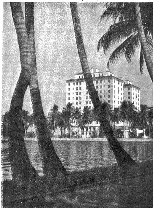
Palm Beach auf Florida. (Verkleinerte Illustrationsprobe aus Hoppé: Das romantische Amerika, Verlag Frey & Wasmuth, Zürich.)

kaum ein zweites imstande ist, uns die romantischen Schönheiten der Vereinigten Staaten eindrucksvoll vor Augen zu