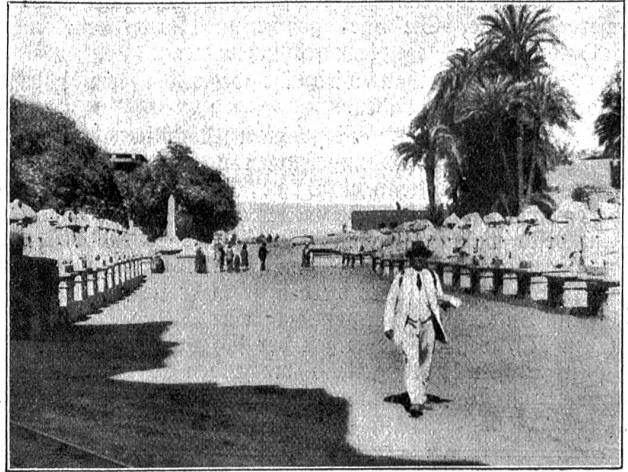
Theben. — Vor dem Amontempel zu Karnak. Vom Nil zum Tempelgang führende Allee von Sphingen, die hier im alten Theben, der Verehrungsstätte des Ammon, dem der Widder heilig war, Widderköpfe tragen.

Dieses Zusammensein mit Landsleuten in Alexandrien wird zu unsern schönsten Reiseerinnerungen zählen, brachte es uns doch von neuem zum Bewußtsein, welch' unlöslich Band das Vaterland und seine Kinder umschlingt, wo in der Welt sie auch immer sein mögen.