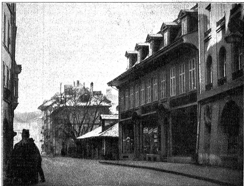
Ansicht der Neuengasse mit den Feuerwehmagazinen usw., an deren Stelle nun der Kyfflihof steht.

*) Die historischen Daten stammen aus Ed. von Rodt's Bernischer Stadtgeschichte.