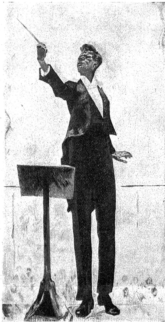
Cuno Amiet: Der Dirigent (1919).

veranstalteten Studienreise durch Ägypten und Nubien. Auf Grund und in Fortsetzung eines anlässlich der 41. Hauptversammlung im Schoße des Verschönerungsvereins der Stadt Bern und Umgebung, am 28. Februar abhin, über diese Reise gehaltenen Lichtbildervortrages, sei gestattet, an dieser Stelle auf die Reiseschilderung zurückzukommen, und zwar unter besonderer Berücksichtigung der Nilfahrt durch Unternubien.