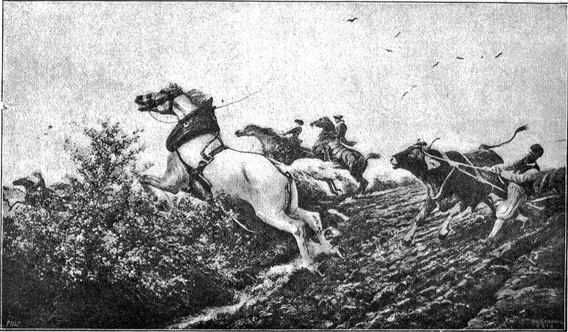
Rudolf Koller: „Alte Erinnerungen“.

das schöne, bekannteste und am meisten reproduzierte Bild „Die Gotthardpost“, das uns Kollers Können in glänzendstem Lichte zeigt. Ein neues Augenleiden setzte 1875 der Arbeit neuerdings Grenzen. Aber Koller ließ sich nicht unterkriegen. Die verminderte Sehkraft hinderte ihn zwar in Zukunft am Malen im Freien, eine harte Nuß, war er doch gewohnt, nur nach der Natur zu schaffen. Aus dem Gedächtnis und nach flüchtigen Skizzen entstand indes noch manch' feines Werk, vielleicht in der Zeichnung etwas weniger exakt als früher, aber von leuchtender Farbkraft. An Ehrungen fehlte es nicht. München überreichte ihm eine Medaille, ebenfalls Paris. Er wurde Mitglied der eidgenössischen Kunstkommission. Die Kunstvereine Basel und Luzern ernannten ihn zum Ehrenmitglied, die Zürcher Universität zum Doktor philosophiae honoris causa. Die großen Festlichkeiten von 1898 anlässlich des 70. Geburtstages zeugten von der Wertschätzung in der engeren Heimat.