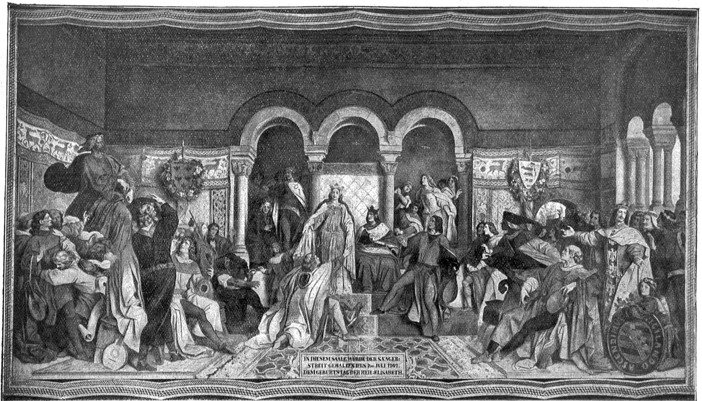
M. v. Schwind: Der Sängerkrieg auf der Wartburg.

trösten lassen wollen. Es zog sie beinahe körperlich nach dem Hause, von dem sie von jeher das Gefühl hatte, als sei es kein Haus wie alle andern. Es schien ihr, als warte das alte Gebäude mit den dunkelgebeizten Treppengeländern und dem weiten Flur darauf, daß man seinen Schatz hebe, der in irgend einer märchenhaften Weise dort verborgen sein mußte. Oft hatte sie leise Tritte zu hören geglaubt, und es war ihr manchmal gewesen, als halte eine zarte Hand sie am Kleid zurück und sie war erschauernd und zugleich mit gespanntem Entzücken stehen geblieben. Oder sie hatte eine flüsternde Stimme gehört: Löse das Rätsel, löse doch das Rätsel, und wochenlang versuchte sie vor dem Einschlafen zu ergründen, was wohl mit jenen Worten gemeint sein könnte.