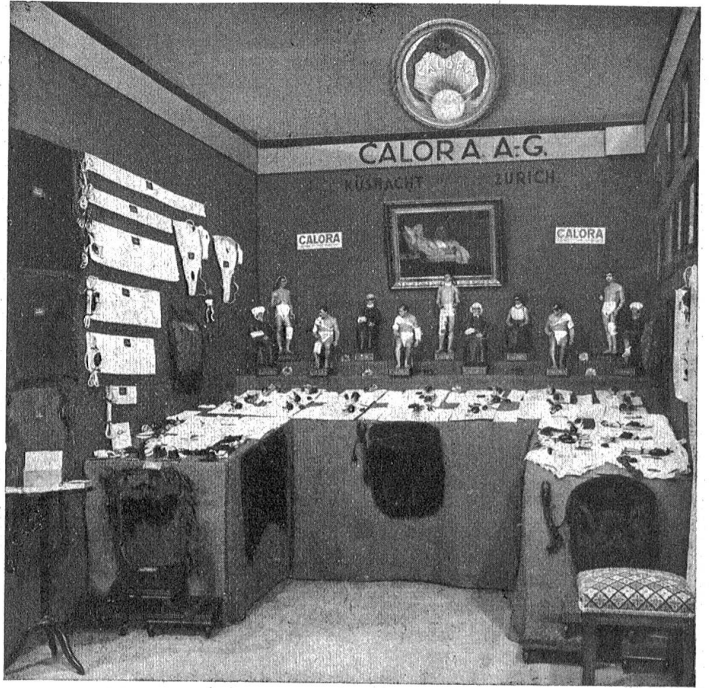
Angewandte Elektrizität an der „Saffa“.