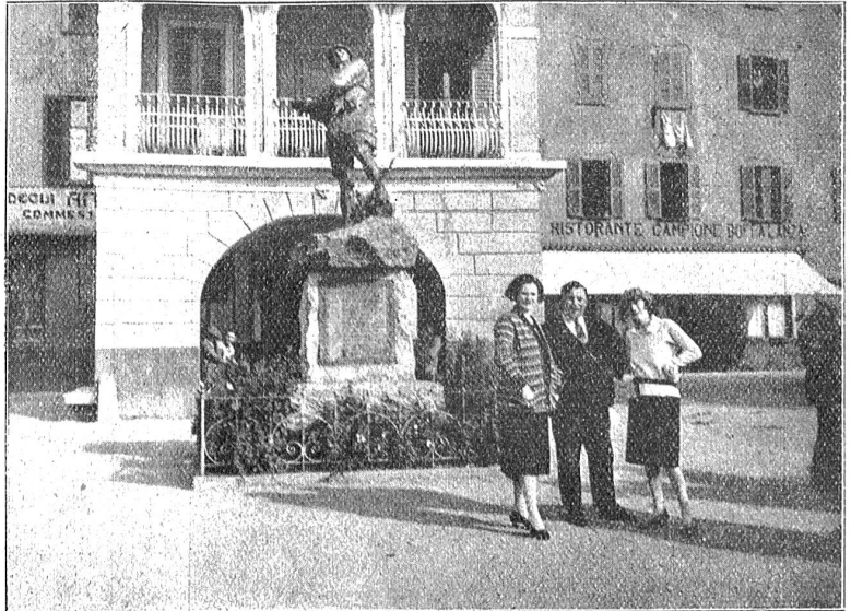
Campione: Das italienische Soldatendenkmal am Quai, das die Namen von 15 im Weltkrieg gefallenen Campionesen trägt.