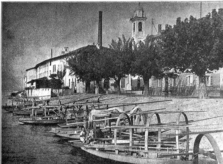
Campione: Am Quai, im Hintergrund die Dorfkirche und die Porzellanfabrik, hinter letzterer das Casino.

früher, und sein Haar war nun so weiß wie das des greisen Salomo auf dem Bilde, und auch die dichten Brauen waren wie Schnee. Davon kam es wohl, daß sein scharfes Gesicht heiterer und freundlicher schien als vordem, oder vielleicht auch von des kleinen Knaben lebhaftem Geplauder, der aufrecht, mit ungeduldigen Schritten an des Vaters Hand ging. Sein Gesichtlein war ernst und klug, wie es zu dem feierlichen Namen Hieronymus paßte, aber die Backen von Landluft gerötet, und es war lustig zu sehen, daß die ährenblonde Mähne über der jungen Stirn denselben eigensinnigen Wirbel formte wie die ungelichtete weiße des Vaters.