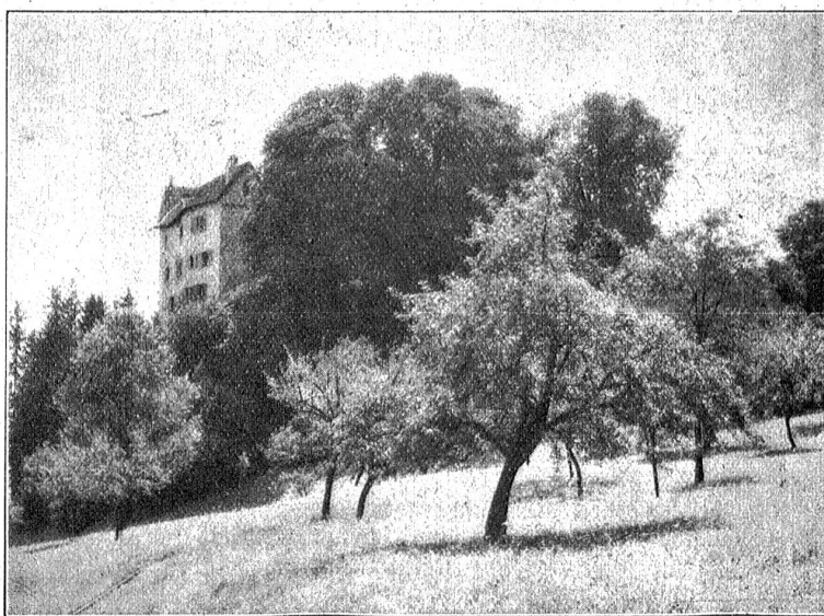
Schloß Wildenstein. Von der Nordseite gesehen.

So ist ein historisch interessantes Objekt nach wechselvollem Schicksal in die Hand eines Besitzers gelangt, der wohl instande ist, die hier durch Jahrhunderte auf die Gegenwart hinüber geretteten idealen Werte zum Segen gegenwärtiger und künftiger Geschlechter wieder aufblühen zu lassen. Das Berner Diakonissenhaus verfügt mit seinen 778 Schwestern und seiner zielbewußten Leitung über ge-