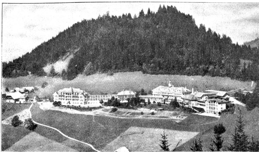
Heiligenchwendi. — Sanatorium.

schlucht liegt. In mäßigem Gefälle westwärts weisend, durchzieht die Poststraße weiter nach Homberg, das zwar auch noch deutlich den Charakter zerstreuter Einzelhöfe oder kleiner Weiler trägt, aber doch in Landwirtschaftsbetrieb, Gewerbe und allerlei Kultur immer mehr dem Flachland sich angleicht. Heimelige Chalets längs der Straße, die brave Bauernwirtschaft, Käseerei, Postbureau, Bäderei, Kramläden, Sägen, Handwerkerhäuser reihen sich nebst sauberen Bauernhöfen längs der Landstraße, in den auf sonniger Hochebene mit 950 Meter Höhe liegenden Weilern Schwendi, Hudhaus, Dreiligasse. Eine viel größere Zahl von Ansiedlungen, wie auch die beiden Schulhäuser von Engenbühl und Moosader, liegen abseits der Verkehrsader in stillen Weilern, umgeben von reichem Obstbaumwuchs. Im äußern Teil des Homberg erhält die Straße ein stärkeres Gefälle, durchzieht in weiten Schleifen waldige Tobel der zur Zug ab rinnenden Bäche und berührt auf dieser untern steilern und einsamern Partie noch die kleine Gemeinde Schwendibach, deren freundliche Gehöfte aus Obstbaumwäldchen heraus oder von steilen Hügelkuppen herab auf die Straße herniederschauen. In neuester Zeit haben sich ihnen ein neues, im Heimatstil erbautes Schulhaus, heimelige Privatsitze und eine kleine Fremdenpension beigeleitet. Noch einmal taucht die Straße in jähem Gefälle in dunklen Lannenwald, der die Gräben des Bösbaches säumt und verläßt das Waldrevier erst vor den Toren von Thun und Steffisburg.