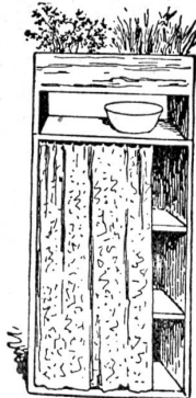
Notzettelkammer auf dem Küchenbalkon

Kattentiste für Schmutzwäsche (verschließ- und fahrbar)