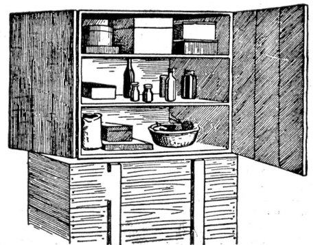
Ausnutzung der Kiste zur Aufbewahrung auf dem Esstisch.