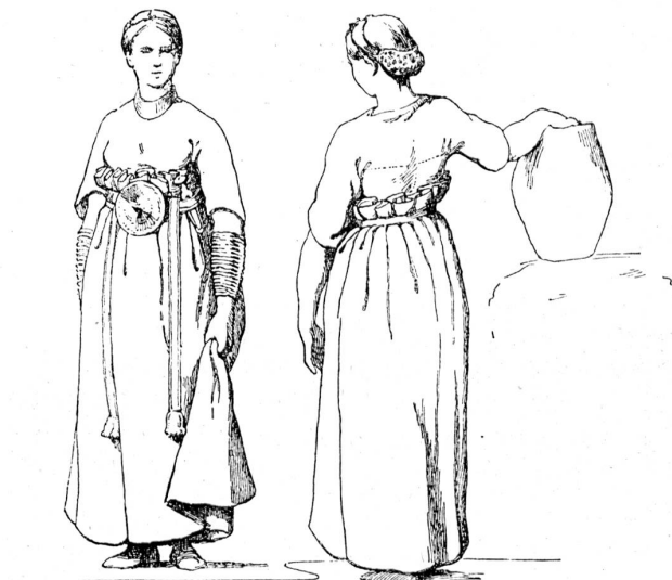
Sräuentracht der nordischen Bronzezeit, nach den Funden in Eichenärgen von Borum-Eshöi (Dänemark). Nach Sophus Müller.