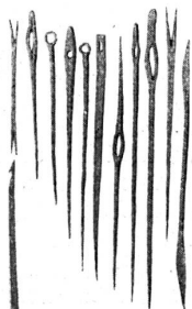
Nahnadeln und Textilgeräte (Pfahlbau Mldau-Steinberg.)

Man weiß, daß die Pfahlbauer bereits die Viehzucht und den Ackerbau kannten, was für Pflanzen ihnen wertvoll erschienen, wie sie diese pfl egten und aufbewahrten, welche Speisen sie sich bereiteten, man kennt die Art ihres Fischfanges und ihrer — schon fast industriellen — Art, sich Werkzeuge herzustellen, so ihre Waffen und insbesondere auch ihre vielen Löpfe und Netze. Die Löpfe, die Verzierungen tragen, teils aus Nägeleindrücken, teils aus Ritzen oder Birkenholzornamenten bestehend, zeugen von Kunstsinne.