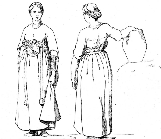
Sräuentracht der nordischen Bronzezeit, nach den Funden in Eichenjürgen von Borum-Eshöi (Dänemark). Nach Sophus Müller.