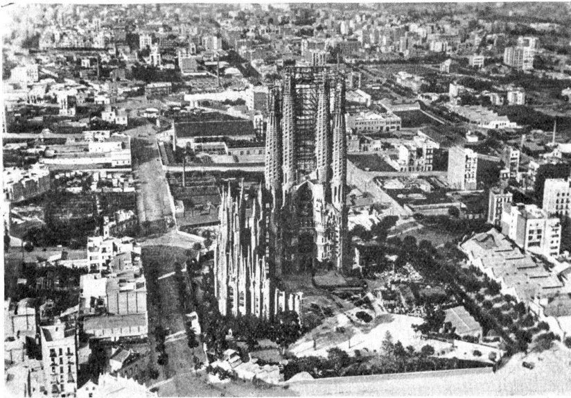
Barcelona, die Hauptstadt Cataloniens (in Spanien). Blick auf die neue Kathedrale.

der stadtberühmten Orgeln im Münster, in der Heiliggeistkirche und in der Pauluskirche beherzigen, was Albert Schweitzer in seinen Forderungen folgenderweise zusammenfaßt: