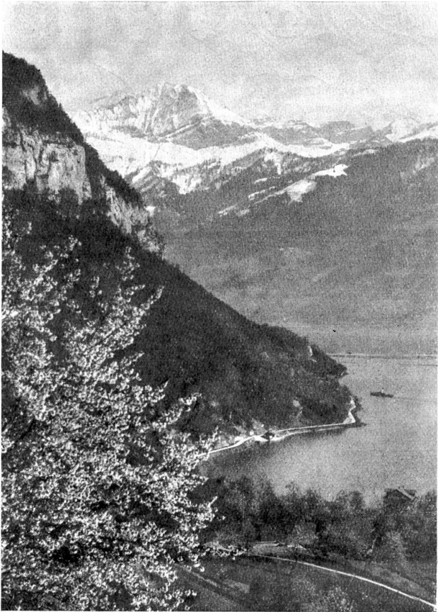
Blick von Merligen auf die Berner Alpen.

„Auch studieren?“ fragte der Staatsanwalt.