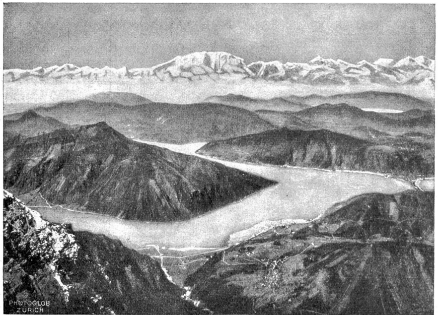
Ausblick vom Generoso auf Luganersee und Walliser Alpen. In der Mitte die Monte Rosa.