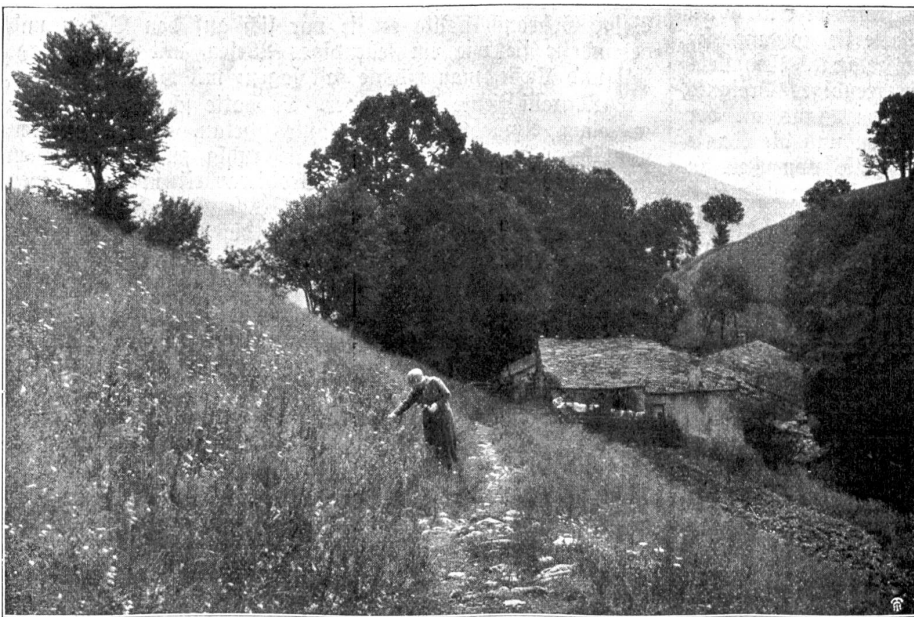
Monte Generoso. Alp Cascina d'Armirone und blühende Wiesen.

Auch die Weiterfahrt zum Kulm ist eine Fahrt durch Pracht und Schönheit. Von den Generoso-Hotels auf Betta führt ein guter Weg in zehn Minuten zum Gipfel, auf dessen Mitte der Grenzstein Schweiz-Italien steht. Hier ist die Aussicht noch überwältigender, umfassender. Wer sie schildern will, der kommt ohne Superlative schlechtweg nicht aus. „Der Hauptreiz liegt in dem padenden Kontrast zwischen Hochgebirge und Tiefland, der Parade alpiner Majestäten, die im Norden vom Monte Rosa bis zum Ortler finglänzend dastehen, und der ungeheuren lombardischen Ebene, aus der in blauer Ferne große weiße Tupfen heraus schauen: Mailand, Pavia, Monza, Piacenza!“ (Schmid.) Aber auch die tessinische Landschaft mit ihren Dörfern, Kirchen und Kapellen, die liebliche, villenumsäumte Bucht von Lugano, nehmen den Blick gefangen. Dann wieder blickt man auf die nahen Felsenhäupter des Monte Legno, des Monte Grigna und Monte Campione, die den Comersee umsäumen, von welchem man eben noch ein Stücklein bei Bellagio erhascht. Auf der andern