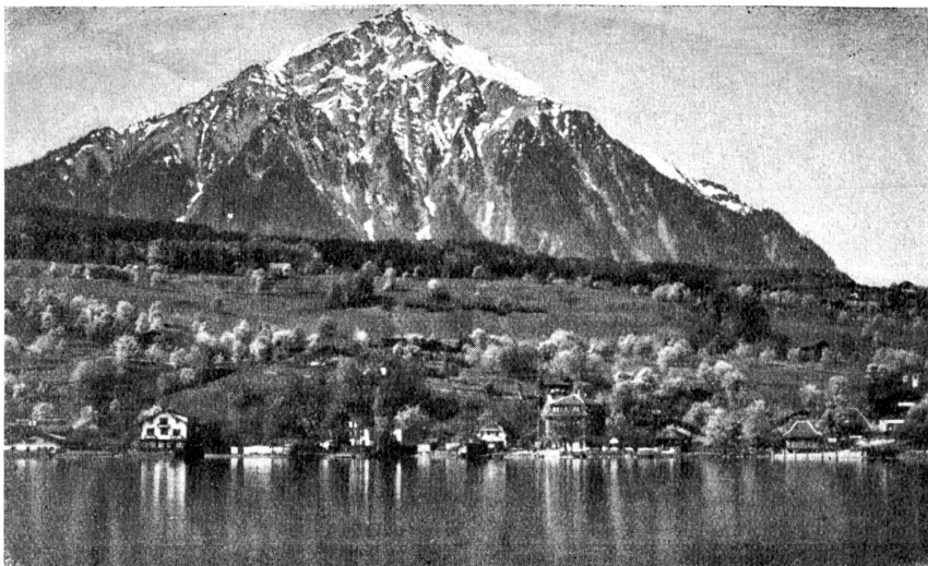
Saulensee mit Döjen.

Columban war ein irischer Glaubensapostel, der zuerst im Reiche der Merovinger wirkte. Als er aber auch die Königsfamilie zu einem christlicheren Lebenswandel anhalten wollte, fiel er in Ungnade und mußte fliehen. Er wanderte darauf den Rhein aufwärts nach Bregenz und von da über die Bündneralpen nach der Lombardei. Er war, wie Beatus, nie in der Schweiz und kam also auch nicht dazu, im Berner Oberland als Glaubensapostel zu wirken. Diese Sagen-Gruppe wurde von den Augustinermönchen von Interlaken