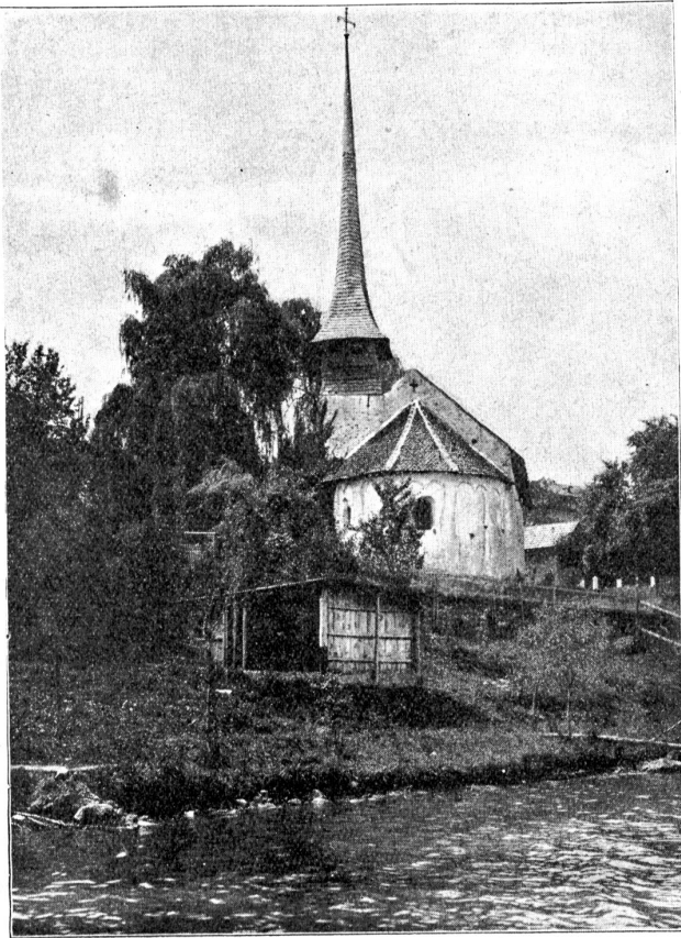
Das Kirchlein von Einigen.

aber in der dritten Klasse sozusagen eingefahren hat, wie ich, so kann man auch dort höchst behaglich reisen. Ich werde