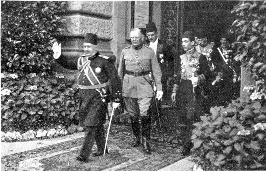
Besuch des Königs Fuad von Aegypten im Bundeshaus in Bern.