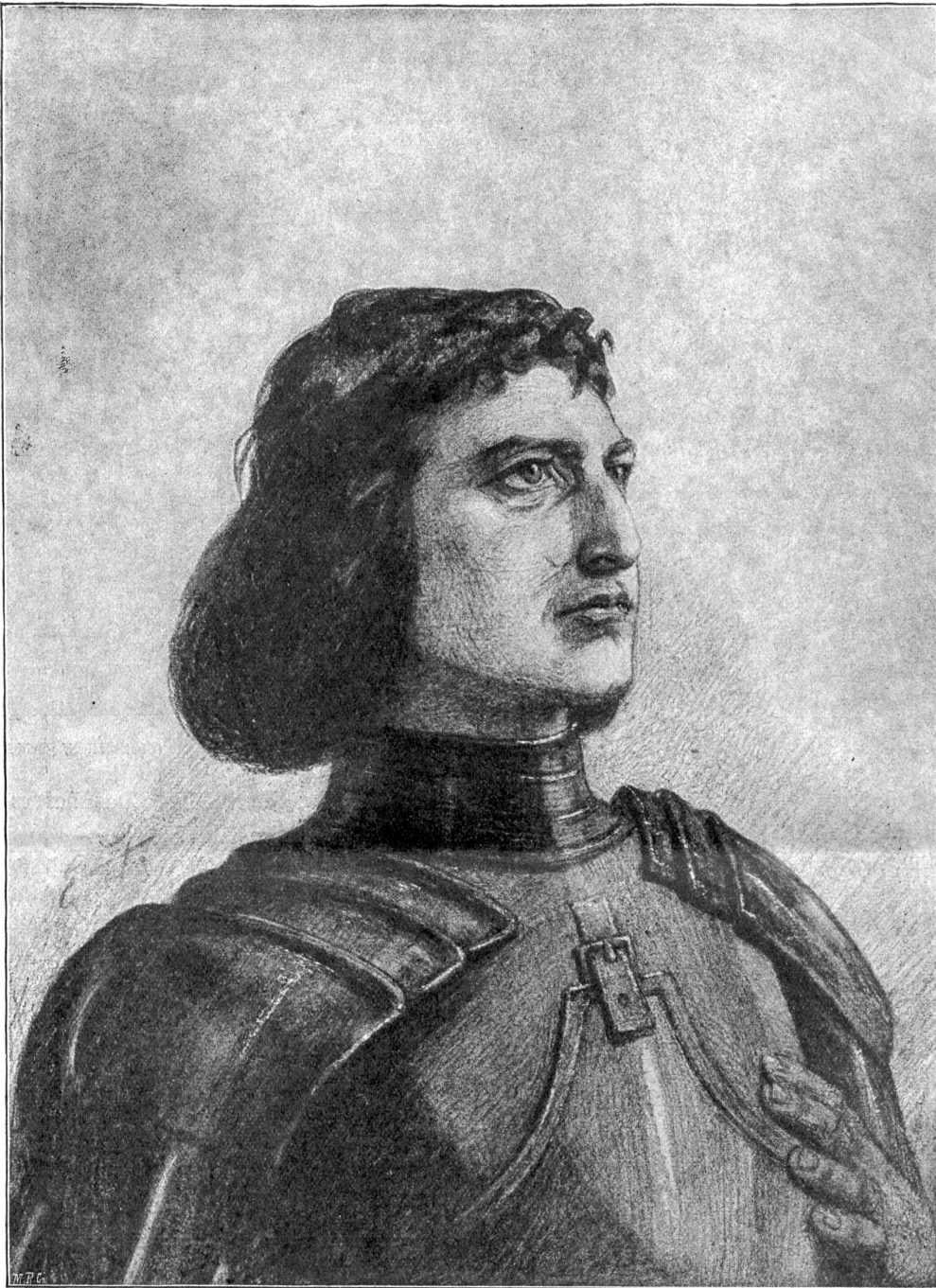
Adrian von Bubenberg. — Zum 450. Todestag.