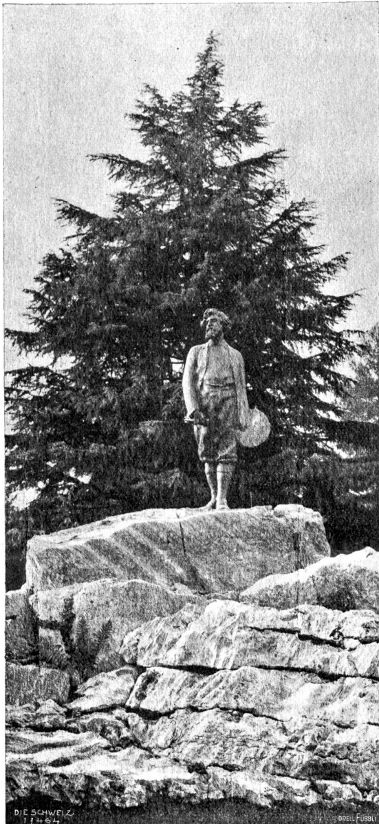
Segantinis Denkmal zu Arco am Gardasee.

Einsamkeit. Dräuend kriecht die Riesenwolke über das besonnte Haupt der trohigen Felspyramide. Kalte, gierige Schatten reden sich nach dem letzten Rest Sonne. Werden