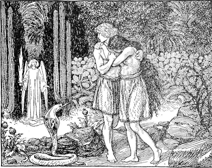
Die Vertreibung aus dem Paradies. (Bernische Kinderbibel, Staatl. Lehrmittelverlag.)